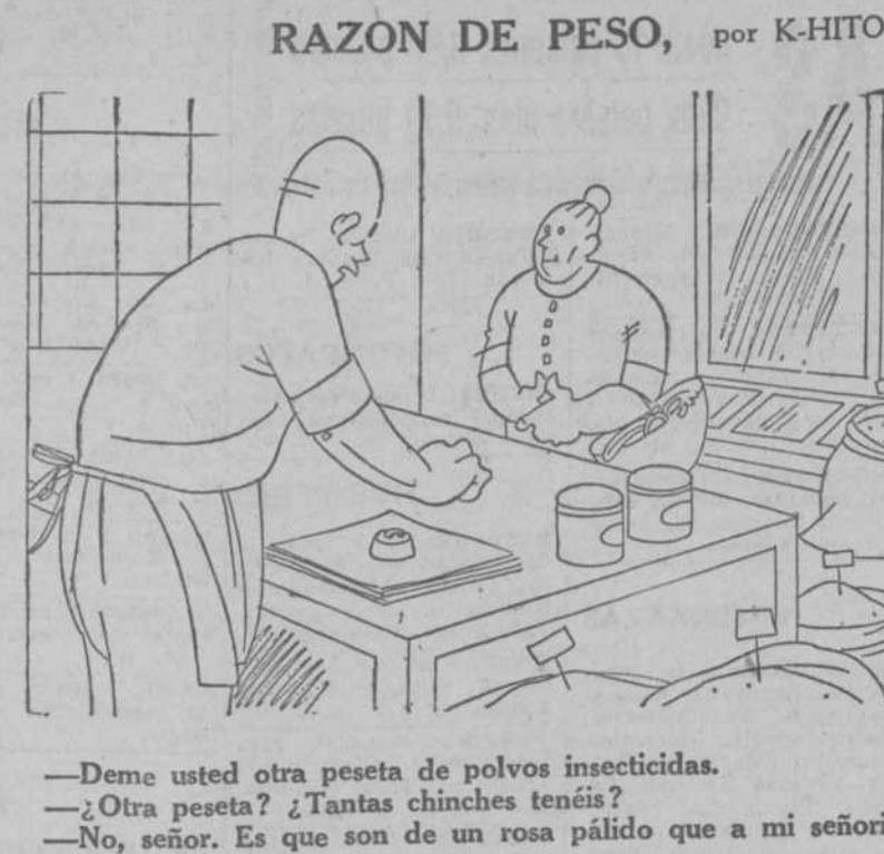
—Deme usted otra peseta de polvos insecticidas. —¿Otra peseta? ¿Tantas chinches tenéis? —No, señor. Es que son de una rosa pálido que a mi señorita la favorecen mucho.