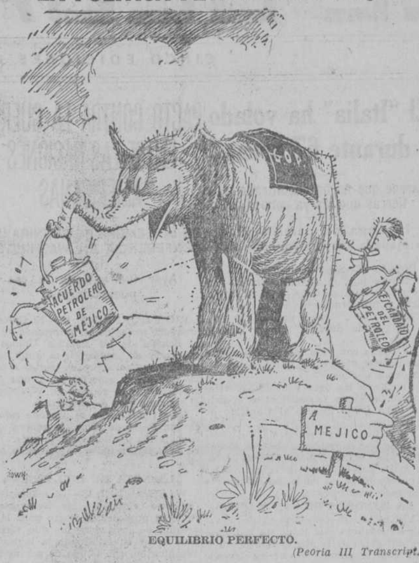
EQUILIBRIO PERFECTO. (Peoria III Transcript.)