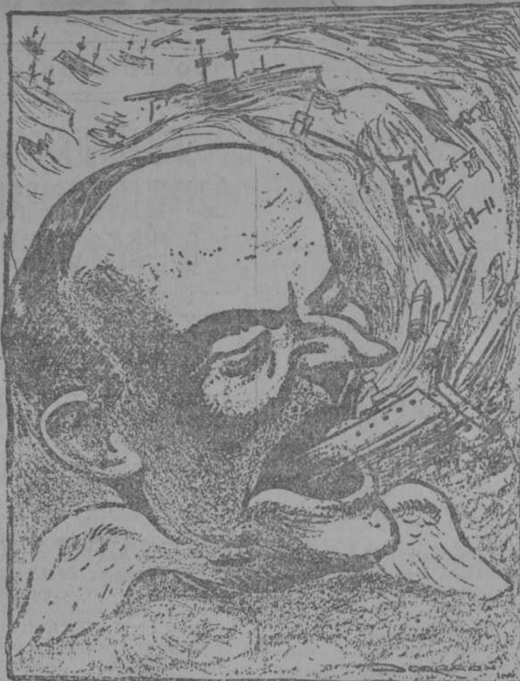
EL PRESIDENTE COOLIDGE HABLA DE PAZ