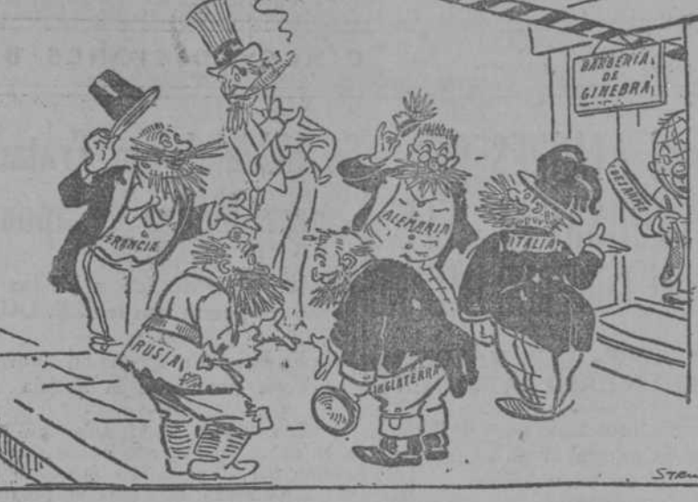
JUSTED PRIMERO! (The Daily Express, Londres.)