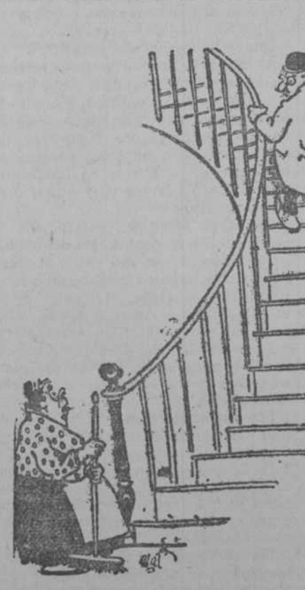
—¿Qué tal va ese enfermo, doctor? —Voy a hacerle la autopsia. —¿Con tal de que no sea tarde! (Le Rire, Paris.)