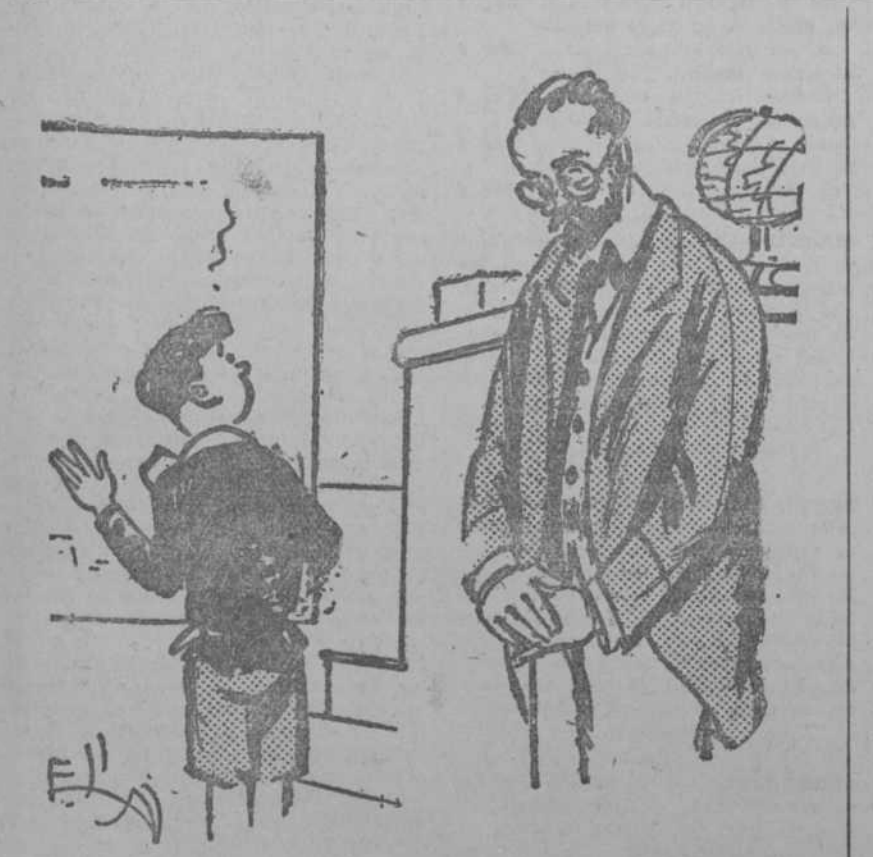
EL PROFESOR.—El sonido recorre trescientos cuarenta metros por segundo; ¿cuántos necesitaría para recorrer diez y seis kilómetros? EL HIJO DEL CHOFER.—¿En «taxi» de cuarenta o de sesenta?