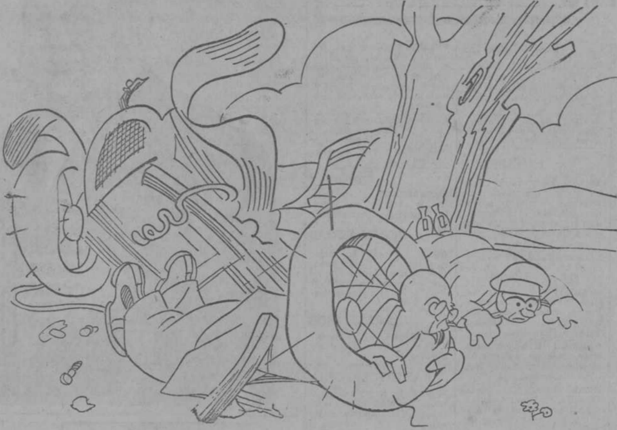
EL HOMBRE FINO (en el aturdimiento del golpe).—La verdad es que yo debía desprenderme del salvavidas y dárselo a mi mujer, que no sabe nadar.