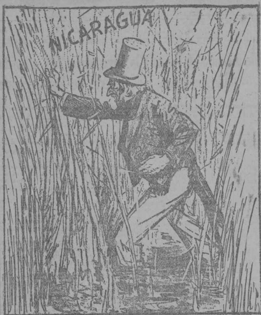
CADA VEZ MAS PERDIDO