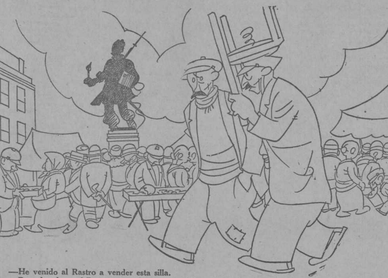
-He venido al Rastro a vender esta silla. -Pero, hombre, ¡al Rastro en un día como hoy! Ve a las Américas.