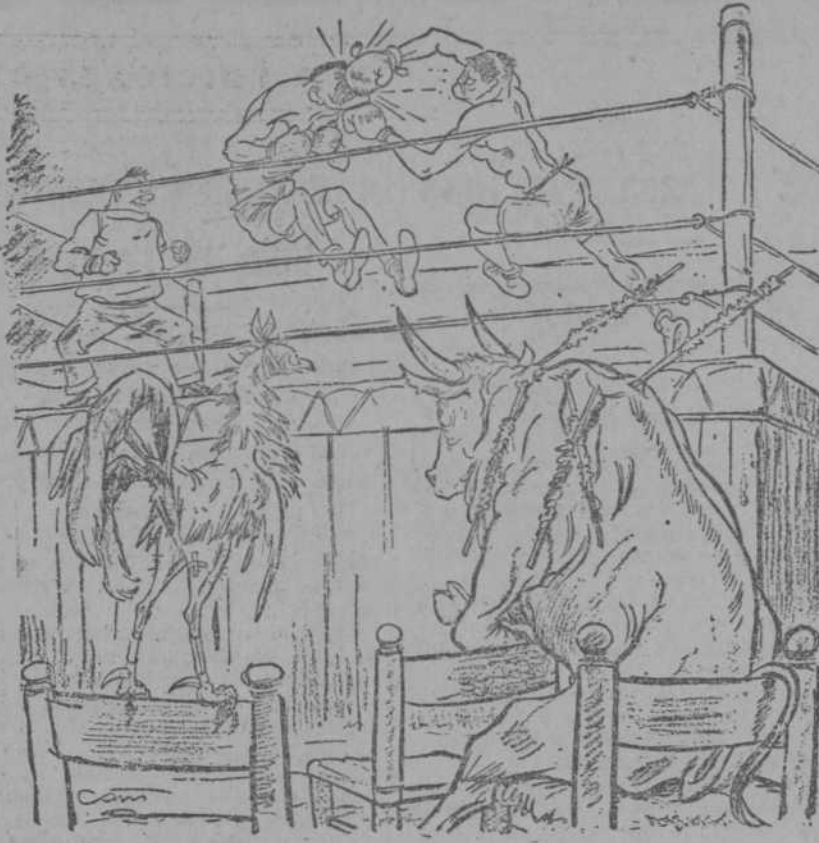
EL TORO AL GALLO DE PELEA.—Hasta hace poco, las bestias éramos nosotros. Il Travaso, Roma.