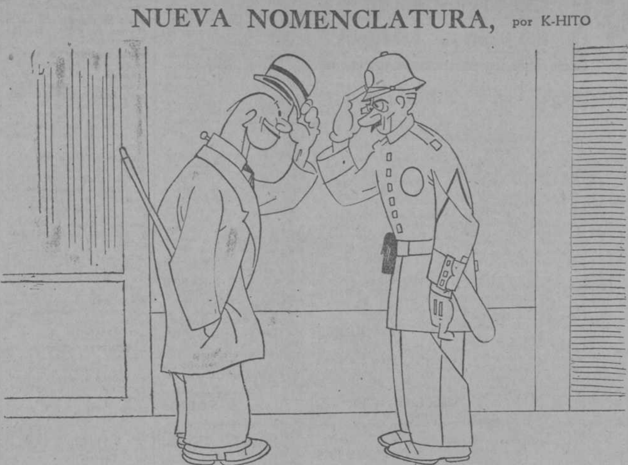
—Hace el favor de decirme, guardia, ¿la plaza de las Cortes? —¡Ah! No sé... Querrá usted decir plaza de la Asamblea Nacional.