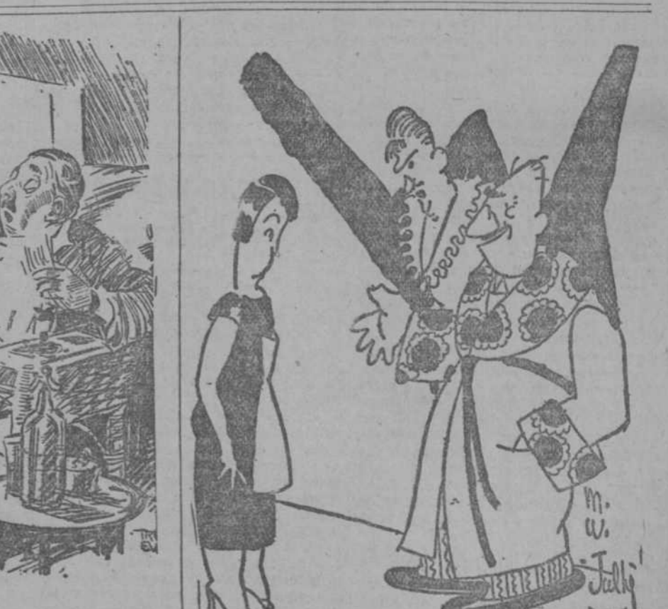
—Pues usted piénselo bien, Nemesia. Si usted renuncia a su proyectado matrimonio para continuar en esta casa, la señora está dispuesta a comprarle una nueva cacerola para la cocina. (Pete Mêle, París.)