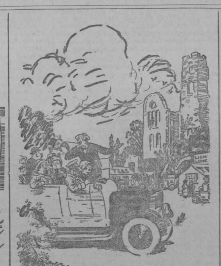
EL GUIA .—Aquí es donde el conde de Dangercourt fué envenenado en mil cuatrocientos ochenta y uno. LA SEÑORA VIEJA .—¡No pretenderéis que nos quedemos aquí a tomar el té!