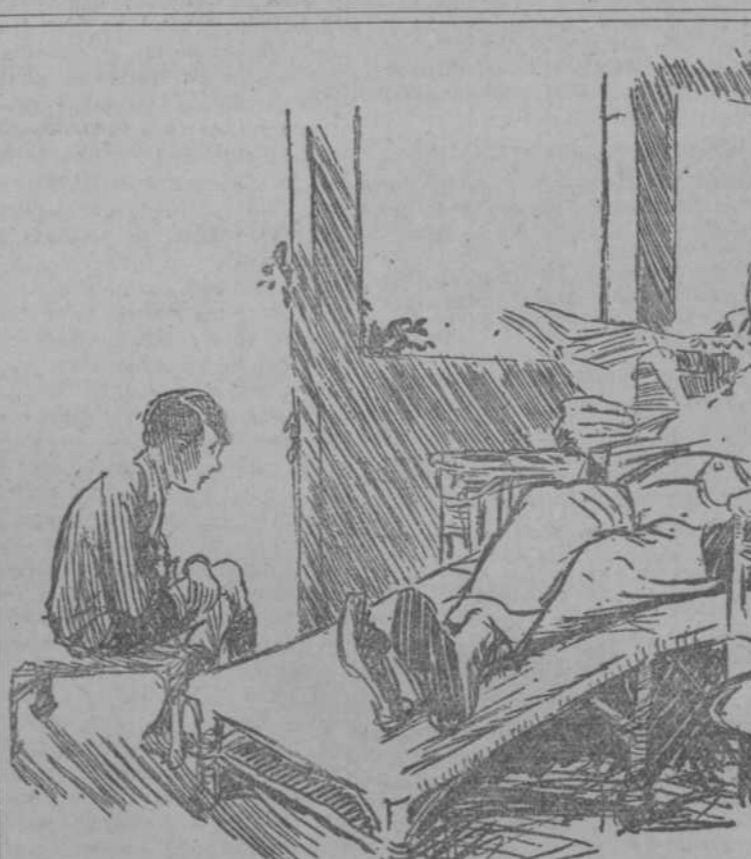
EL CHICO .—Oye, papá, ¿van los indios siempre en filas de uno? EL PADRE .—Yo sólo vi uno; pero, en efecto, así iba. (Passing Show, Londres.)