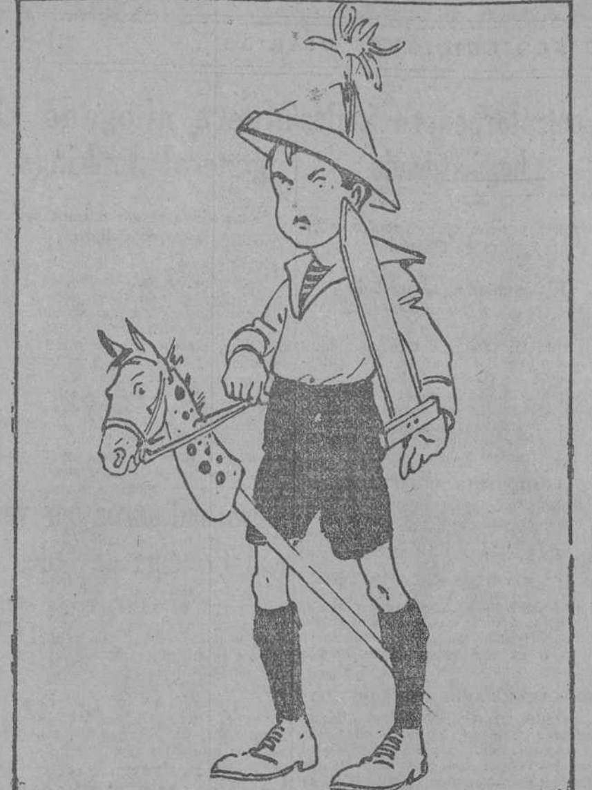
—Inglaterra nos ha concedido un agregado militar. —Debe usar nuestros armamentos. (Del Kikiri , Viena.)