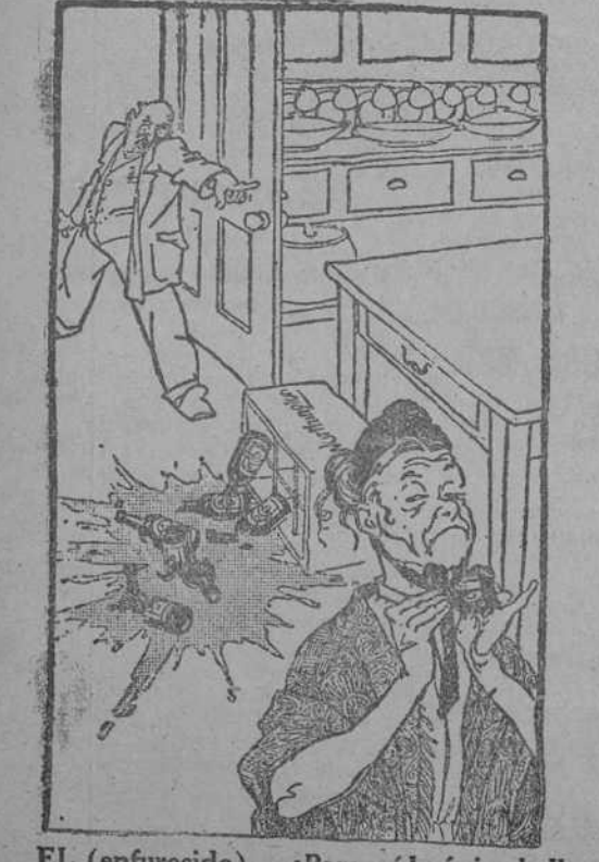
EL (enfurecido).—¡Para mí lo único bello que había en el mundo era eso que has destruido! ELLA.—Me alegro mucho; así no sentiré celos de nadie más. (Punch, Londres.)