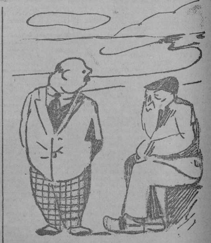
—Dicen que es usted muy viejo. —Sí; tengo noventa y siete años; pero eso no es nada... ¡Si mi padre viviera tendría ahora ciento treinta y uno! (Jugend, Munich.)