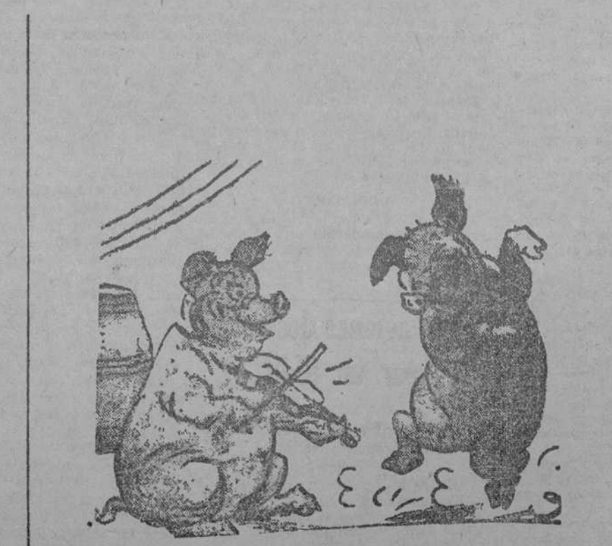
¡Hasta dónde llegó el charleston! (California, Estados Unidos.)