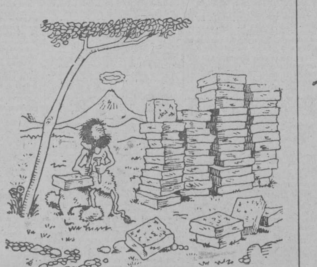
«EL ESCRITOR DE LA EDAD PRIMITIVA.—Me han devuelto todas mis crónicas del periódico... Bueno; me haré un hotelito. (Kasper, Estocolmo.)»