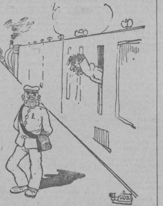
«EL VIAJERO SOMNOLIENTO.—Perdón, señor empleado, ¿tengo tiempo de ir a la cantina? —Seguramente, porque hace dos horas que se terminó el viaje. (Dimanche Illustré, Paris.)»