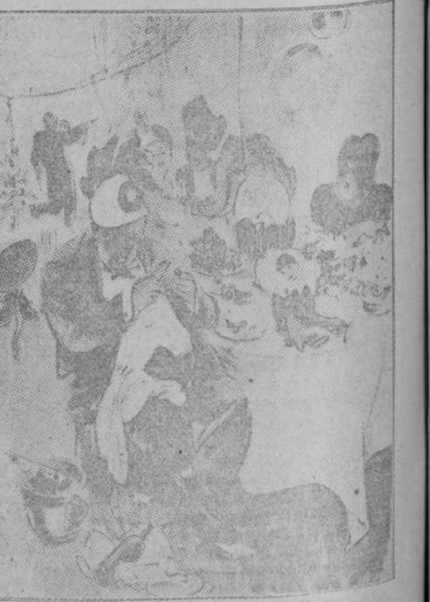
«LA MUJER.—Creo que sería preferible irnos ahora. Jorge Empiezas a partir las uvas con el cascanece. (Sketch, Londres.)»