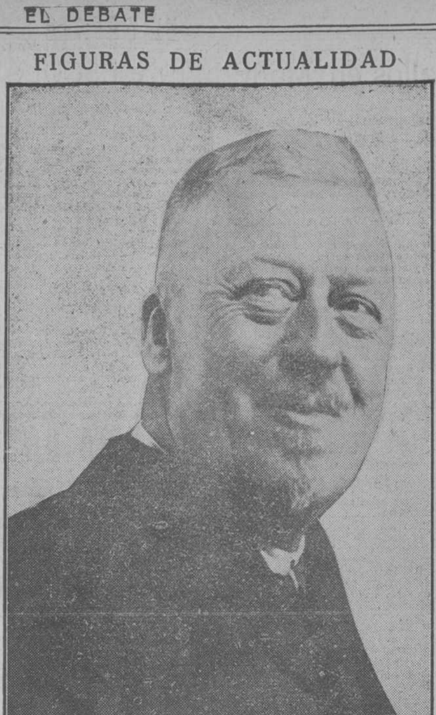
El ingeniero alemán señor Eckener

Como presunto autor del hecho ha sido detenido un individuo al cual lo vago ocupada una ganza con la que se abre perfectamente la puerta de dicha tienda.