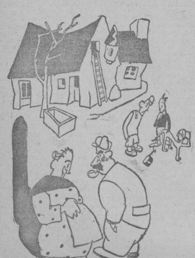
«Pero ¿ha visto usted, señora, esos cafes sin corazón? —Es de usted el perro? —No, señora; pero el caso, sí. (Dimanche Illustré, Paris.)»

En virtud de esta sentencia, se sorteará entre los acusados uno, que deberá ser ejecutado. Los tres restantes sufrirán diez años de cárcel, además de la pena que se les impuso en la primera vuelta.