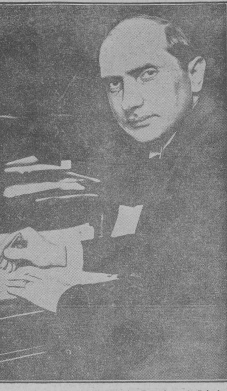
Augusto Zaleski, ministro de Negocios Extranjeros de Polonia, representante de su patria en el Consejo de la Sociedad de Naciones

El ministro polaco comparte con Stressemann los honores de la actualidad en Ginebra. Los asuntos que el Consejo discute son apenas un pretexto para que los dos ministros se hayan reunido en la ciudad suiza a estudiar el modo de resolver los conflictos pendientes entre Alemania y Polonia.