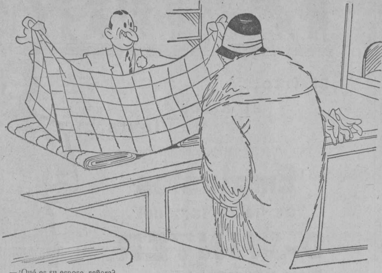
—¿Qué es su esposo, señora? —Empresario de teatros. —Entonces, permítame que le recomiende esta piececita en varios cuadros...