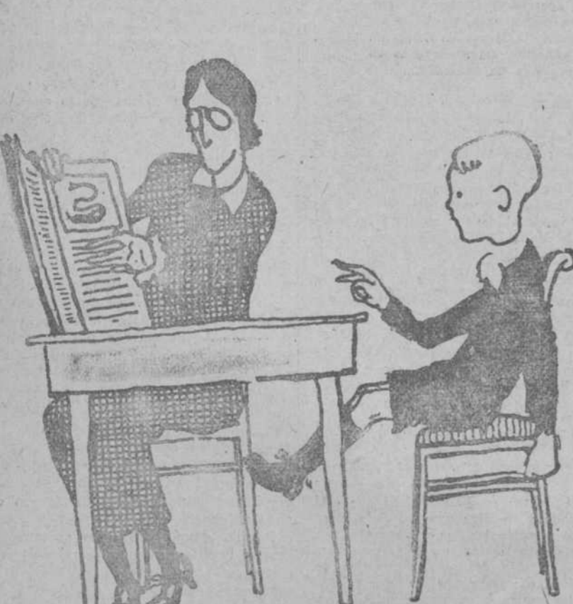
—Dígame, señora profesora, cuando la serpiente quiere mear la rola, cómo se arregla para saber dónde le empieza? (De Notenkraaker, Amsterdam.)