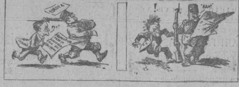
COOLIDGE.—¡Aaaaay! (Del Commercial Appeal, Memphis.)

El presidente de los Estados Unidos persigue a Europa con su proposición de desarme naval. La respuesta de Europa, mientras examina las proposiciones, resulta muy elocuente.