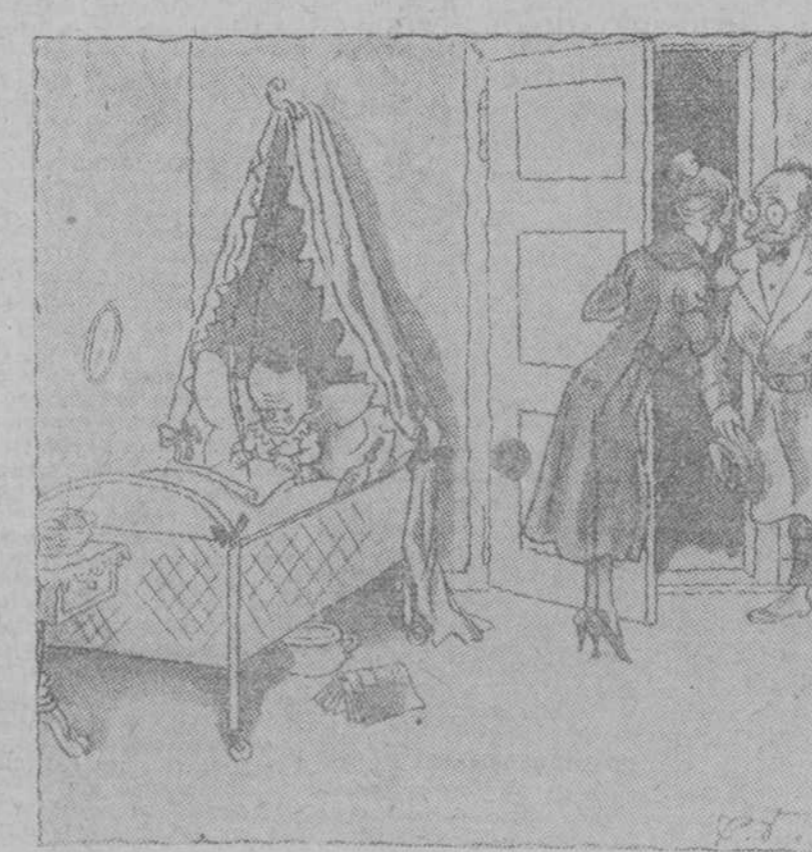
LA INFANCIA —¿Christ! Hable bajo. —¿Duerme? —No; está escribiendo un drama. (Lustige Blätter, Berlin.)