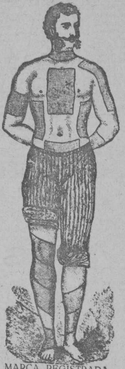
MARCA REGISTRADA Exigida en la cubierta de cada Emplasto.