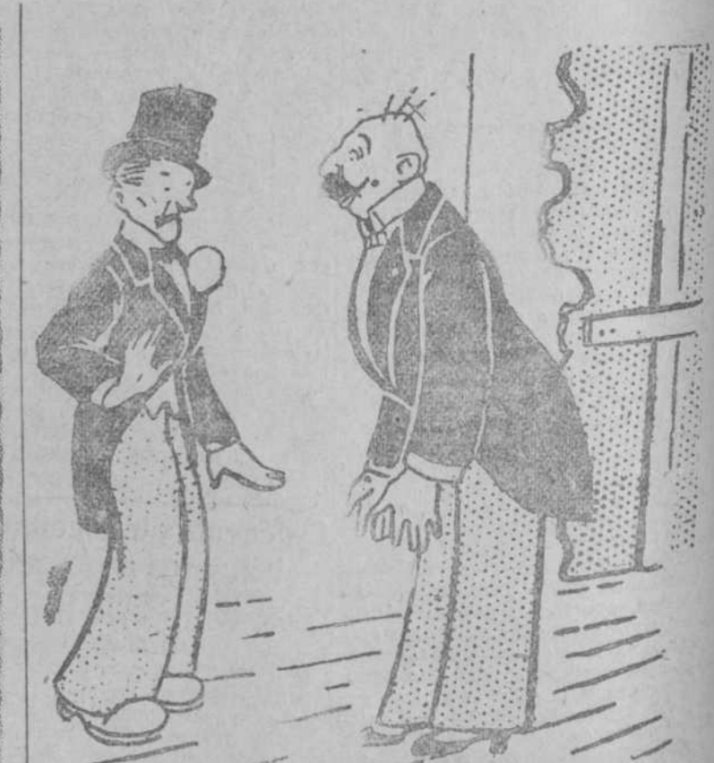
EL DIRECTOR DE ESCENA AL ACTOR.—¡Es imposible! ¿Cómo va usted a hacer el papel de borracho si viene borracho todas las noches? (Pasquino, Torino.)