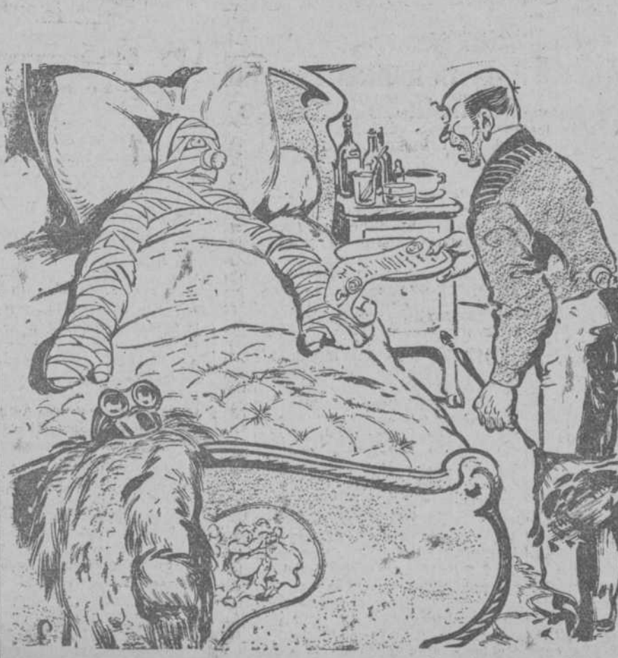
—Es la Dirección de Policía, que envía al señor su licencia para conducir. (Le Rire, Paris.)