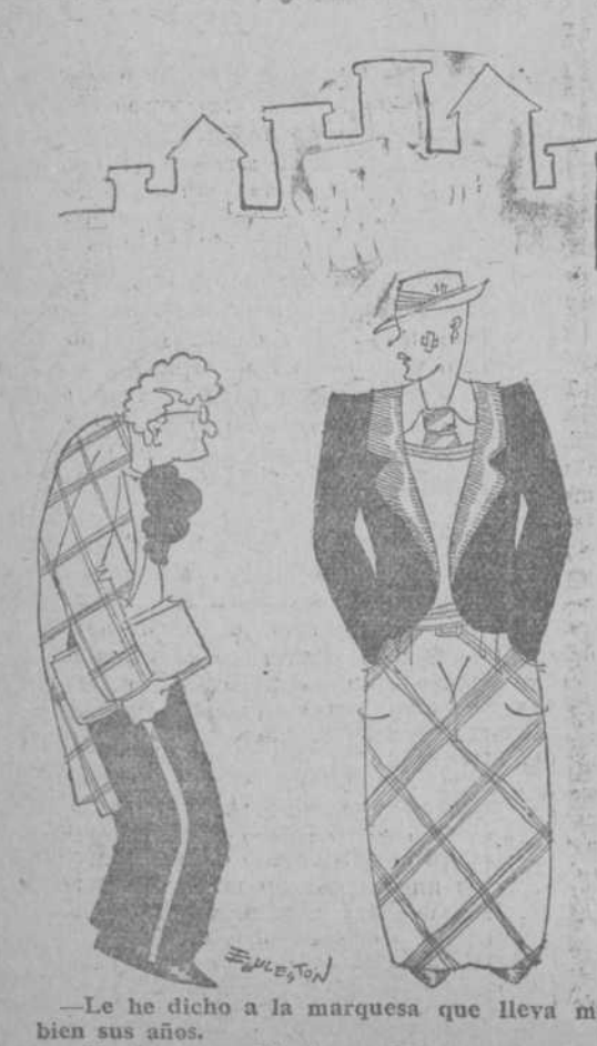
—Le he dicho a la marquesa que lleva muy bien sus años. —No lo creas. Pierde muchos. (California Pelican, EE. UU.)