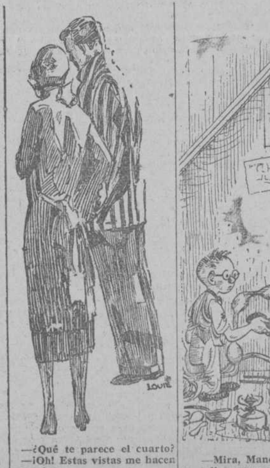
—¿Qué te parece el cuarto? —¡Oh! Estas vistas me hacen envidiar. —Bien. Lo tomo por noventa y nueve años. (Stanford Chaparral, EE. UU.)