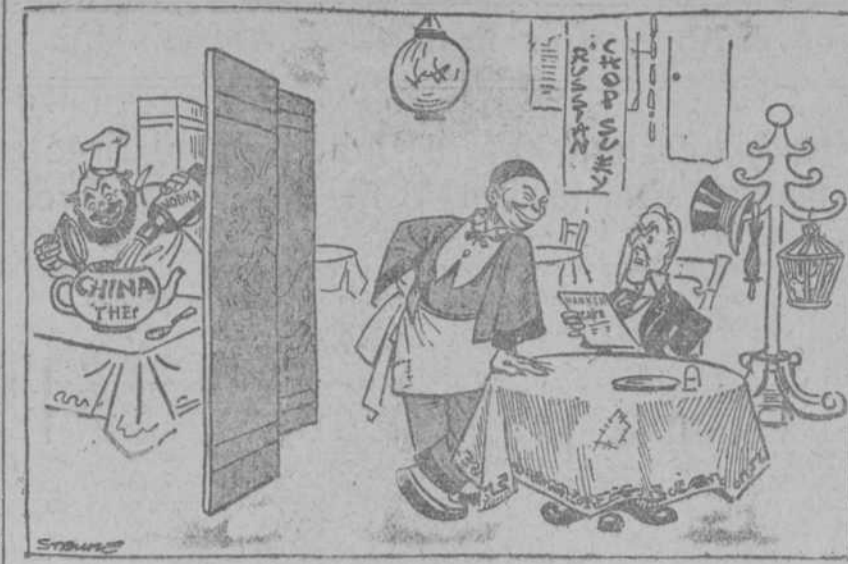
EL CAMARERO A CHAMBERLAIN.—Perdone, señor, que le haga esperar; pero estamos preparando el té especialmente para usted. (Del Daily Express.)

Detrás de la mampara, el ruso echa en la tetera evodka, la famosa bebida rusa. El té chino que les preparan a los ingleses—representados por Chamberlain—es un té con gotas... bolcheviques. Alude la caricatura a los manejos de los comunistas en China.