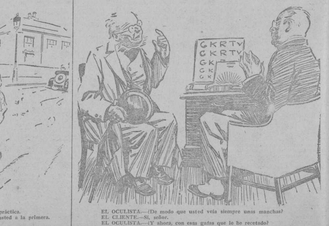
EL OCULISTA.—¿De modo que usted veía siempre unas manchas? EL CLIENTE.—Sí, señor. EL OCULISTA.—¿Y ahora, con esas gafas que le he recetado? EL CLIENTE.—¡Ah! ¡Muy bien! Las veo mucho mejor. (The Humorist, Londres.)