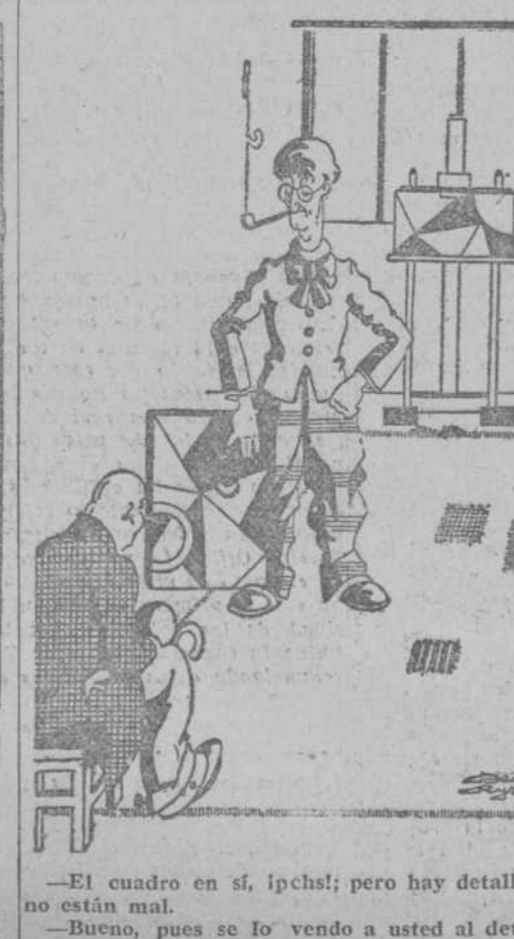
—El cuadro en sí, ¡pchs!; pero hay detalles que no están mal. —Bueno, pues se lo vendo a usted al detall. (Dimanche-illustré, Paris.)