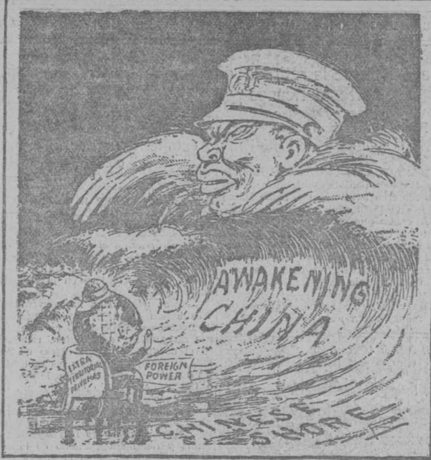
¿Podrá contenerse esta vez la marea, como se ha contenido otras veces? (Del Daily Star, Montreal.)