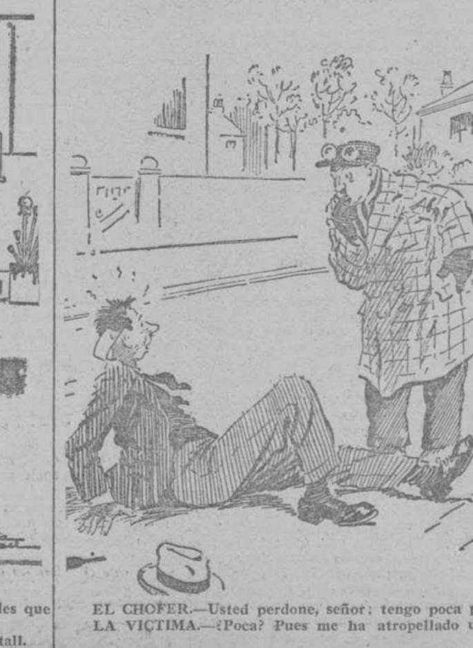
EL CHOFER.—Usted perdona, señor; tengo poca práctica. LA VICTIMA.—¿Poca? Pues me ha atropellado usted a la primera. (London Opinion, Londres.)