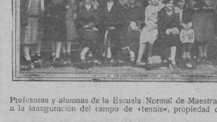
Profesoras y alumnas de la Escuela Normal de Maestras que asistieron a la inauguración del campo de «tennis», propiedad de aquel Centro.