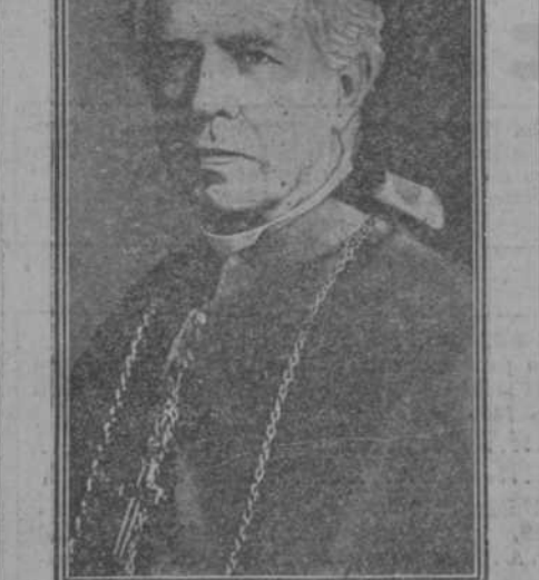
El ilustre Arzobispo de Méjico, don José Mora del Río, a quien el Gobierno de su país tuvo encarcelado.

Desaparecen de Orleans objetos sagrados ofrecidos por los Reyes de Francia