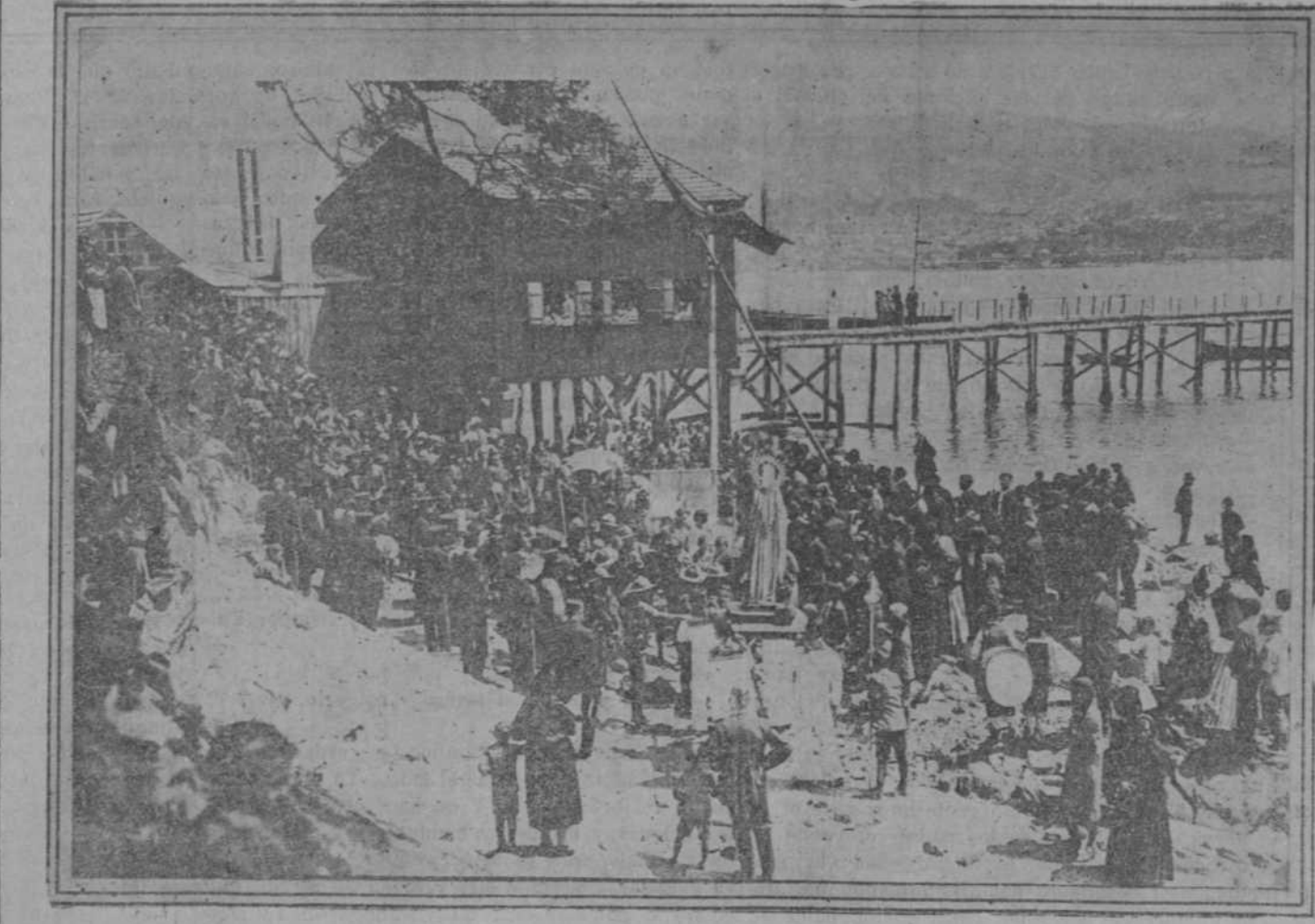
Un momento de la colocación de la primera piedra del muelle que se va a construir en Ocaña (Pontevedra), a cuya ceremonia se llevó en procesión a la Virgen del Carmen.