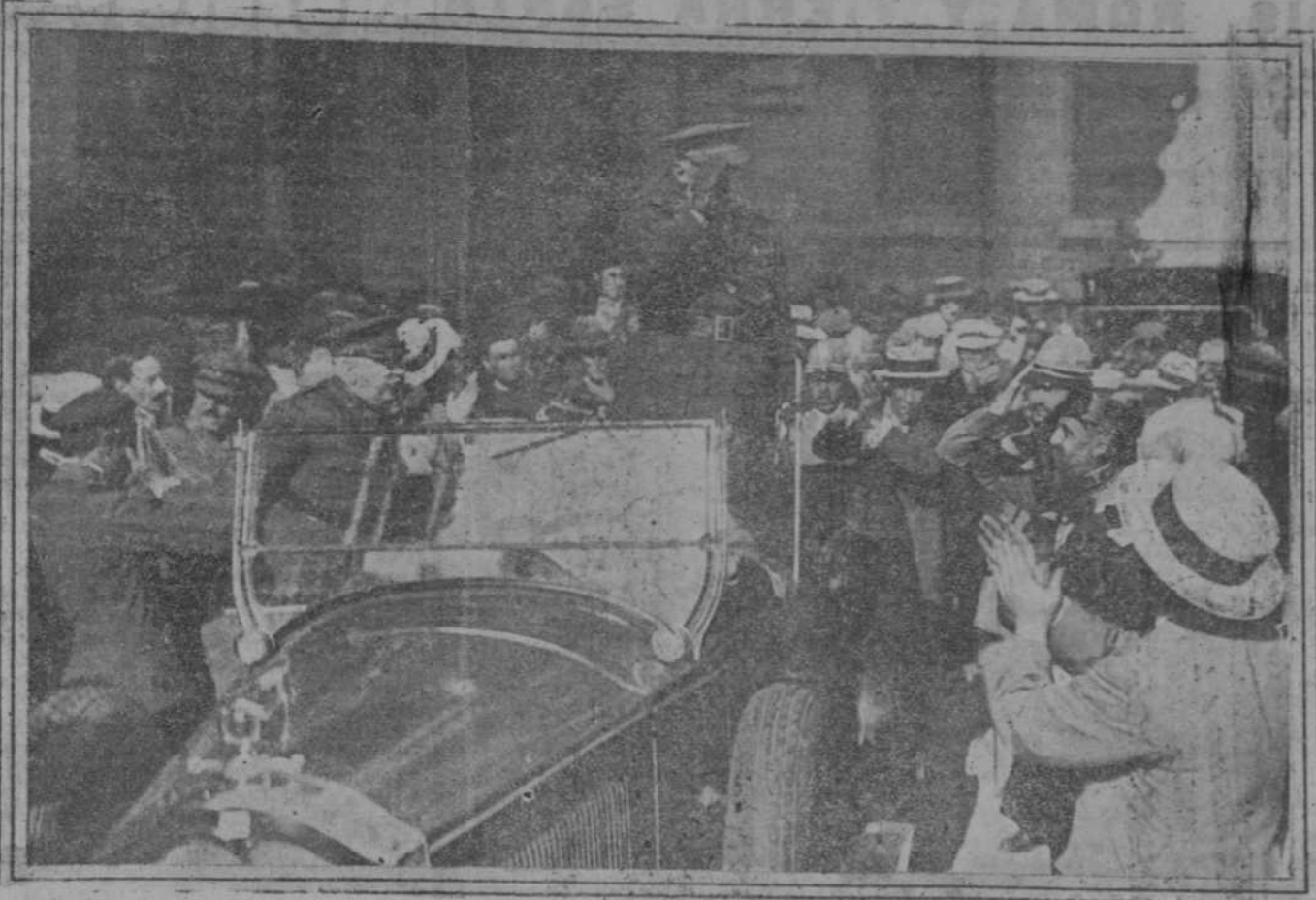
El general Primo de Rivera aclamado a la salida de la estación momentos después de llegar a Valencia, donde ha ido con objeto de asistir a la botadura del buque que lleva su nombre.