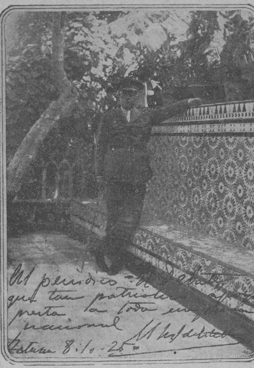
Recientemente nos dirigimos al presidente del Directorio en solicitud de uno de sus últimos retratos. El general ha tenido la amabilidad de darnos el adjunto, con una dedicatoria que dice así: «El periódico EL DEBATE, que tan patriótico apoyo presta a toda empresa nacional.—El marqués de Estella.»