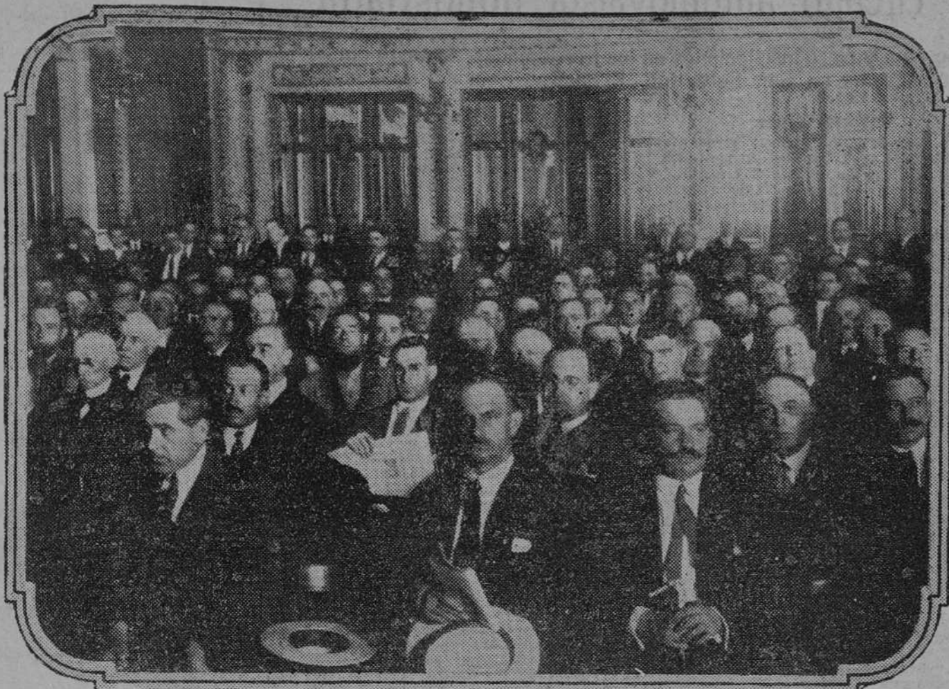
Aspecto del salón de actos del Círculo Mercantil durante la celebración de la Asambléa