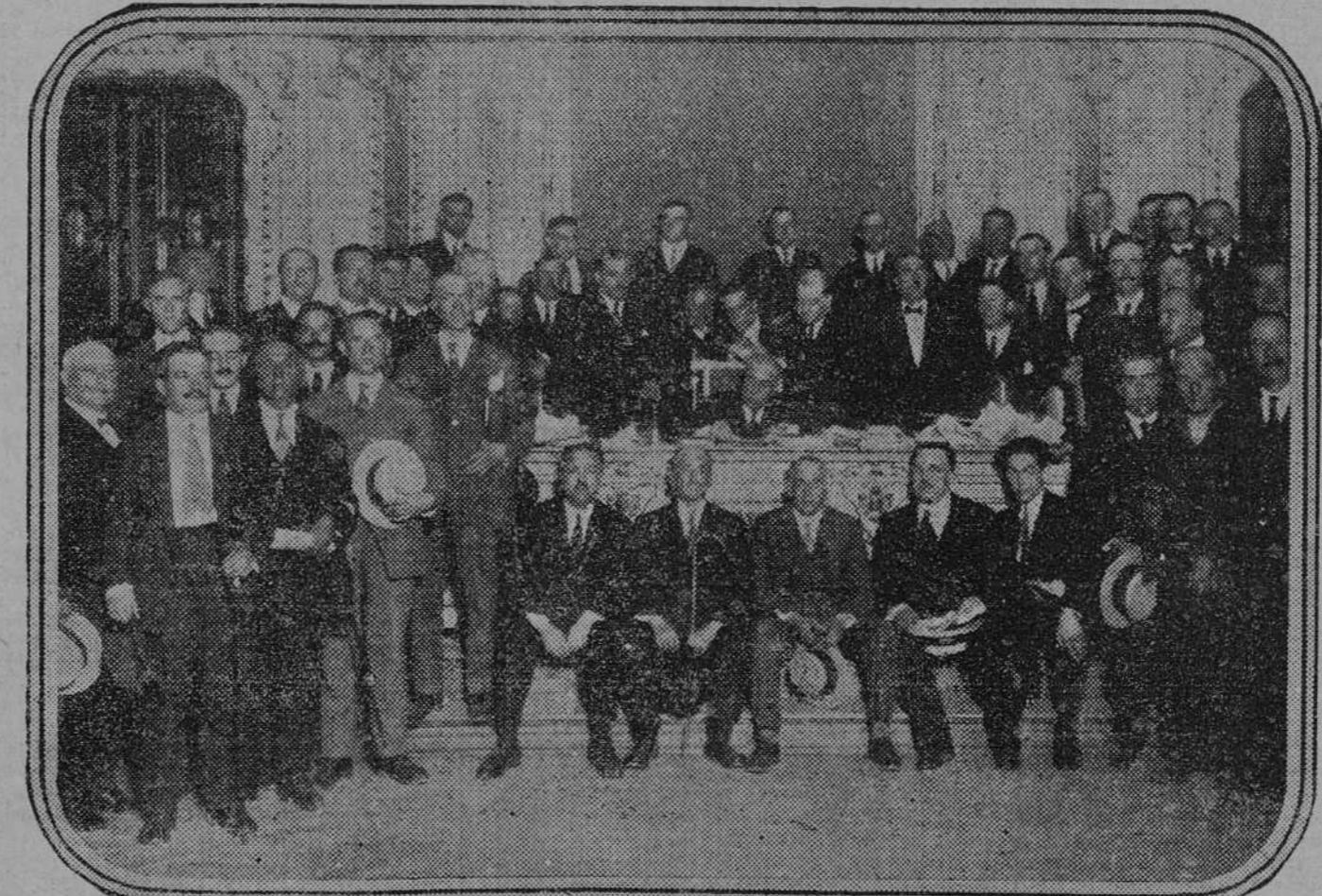
Mesa presidencial de la Asambléa vitivinícola celebrada ayer en esta Corte

Es opinión general que la desaparición del partido de acción republicana simplificará grandemente el problema político.