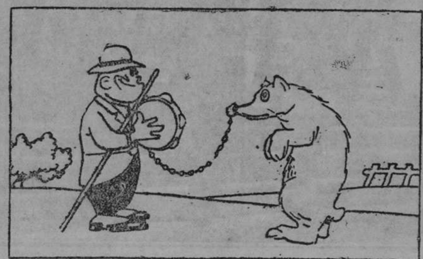
—Este oso baila hoy de coronilla. Es cuestión de serenidad y no dejar el palo de la mano.