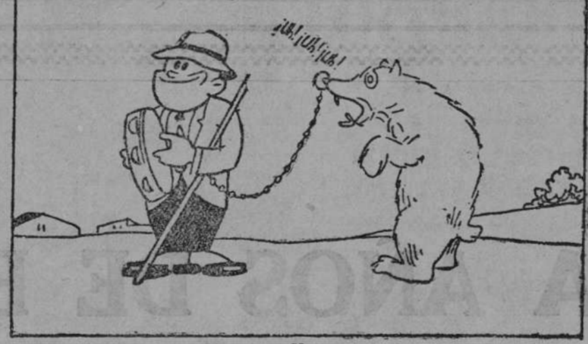
—¡Bravatas a mí! ¡Ejem!