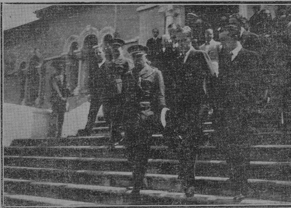
Su Alteza saliendo de visitar el nuevo hospital de Avités