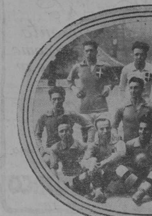
Equipo italiano que eliminó al representante de España en los Juegos Olímpicos. Su mayoría jugará el domingo en Valencia.