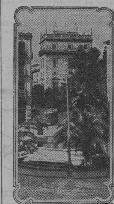
Plaza de la Constitución y Audiencia