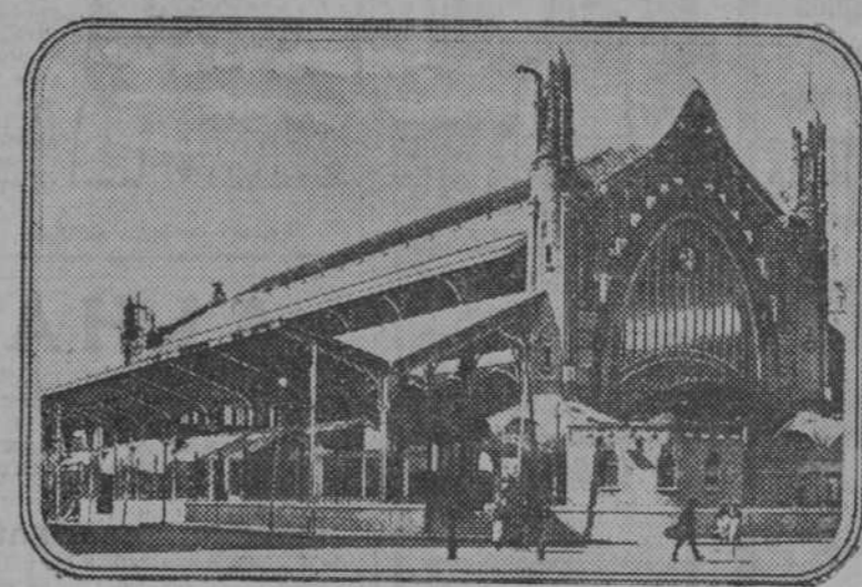
Mercado de Colón