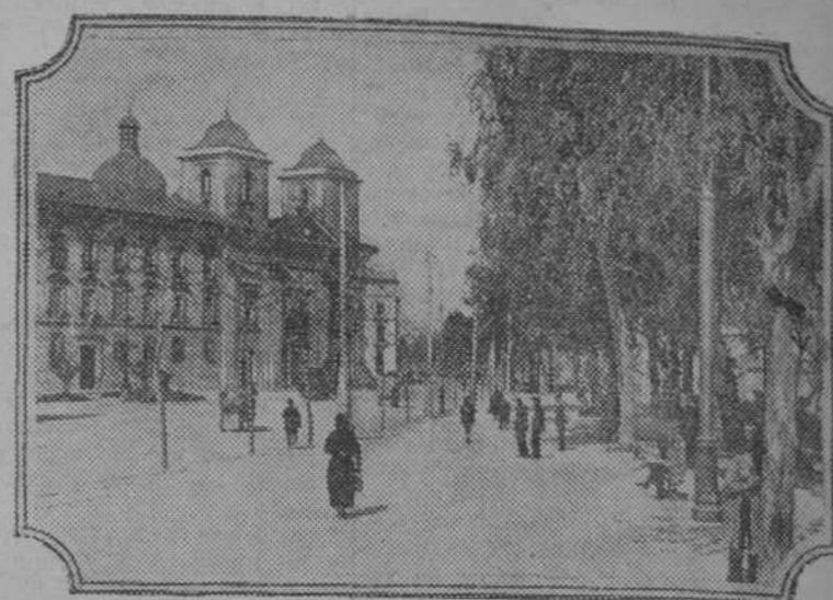
Templo y muro de Santa Ana

Mucha parte del éxito de estas Ferias se debe a la gran propaganda que se hace de la misma, repartiéndose entre todos los países y en variados idiomas numerosos impresos, aparte de que en diversas ciudades de las más importantes del mundo hay montadas Delegaciones oficiales del Comité.