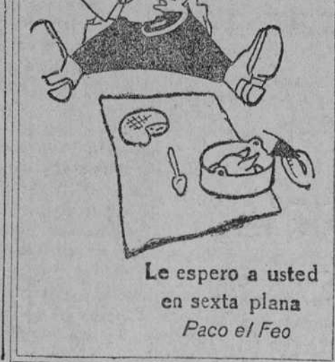
Le espero a usted en sexta plana Paco el Feo

El general ha solicitado los pasaportes y permisos necesarios para trasladarse al extranjero, porque se propone pasar mes y medio en París.