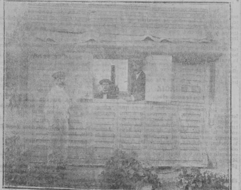
OBSERVATORIO DEL EBRO.—Otra instalación.

Las maniobras comenzarán por una exploración estratégica, que realizarán dos regimientos, el día 9, empezando las maniobras propiamente dichas, el día 11.