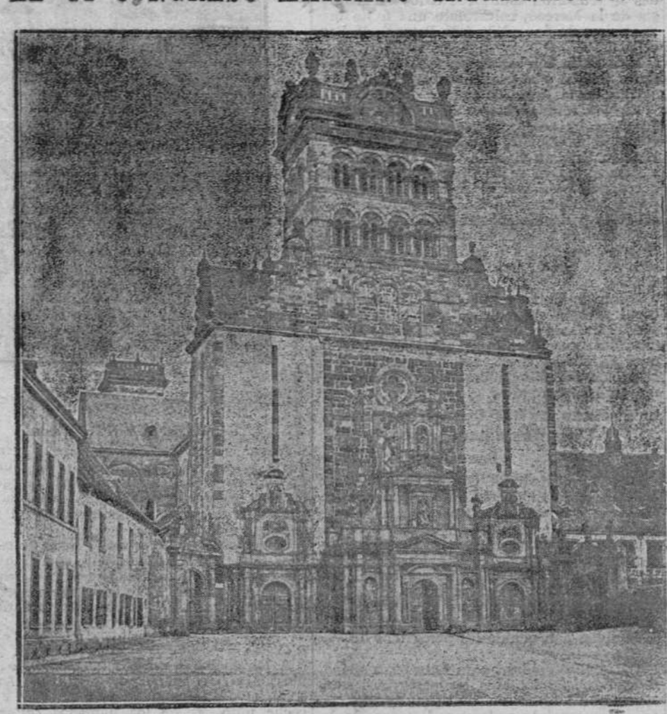
Iglesia de San Matías en Tréveris, de donde saldrá la procesión del Congreso.

Tréveris; c). Las de jóvenes, en el Círculo Católico de los Bourgeois. Las sesiones acabarán antes de las diez.