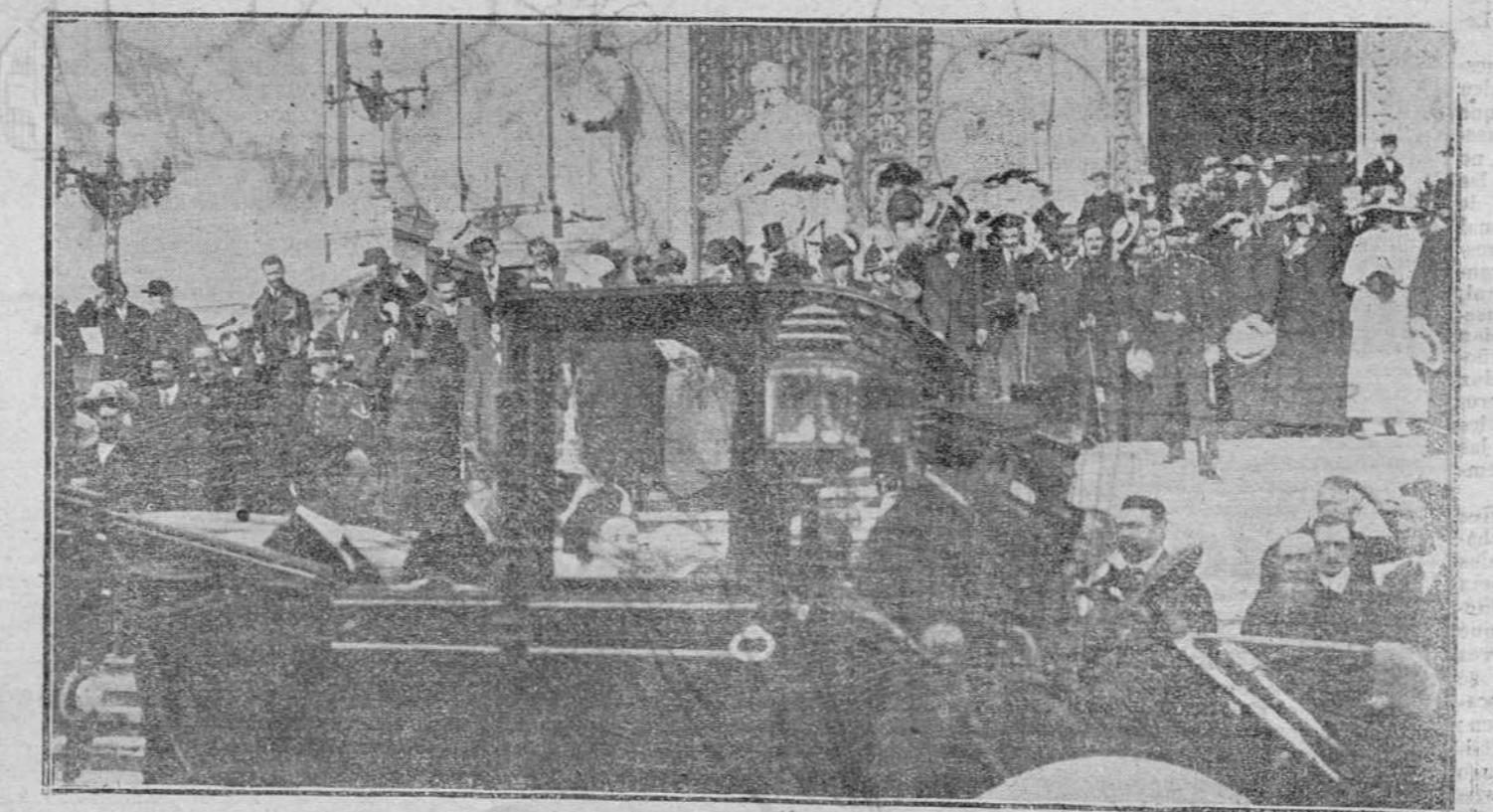
S. M. el Rey al llegar al Palacio de Bibliotecas y Museos de Madrid.

Porque este es, después de lo firmísimo de su fe, el carácter más peculiar de Marcelino . Aunque como estético pensador distinguiere la belleza de la verdad, no menos que la bondad de la belleza, como pensador ontológico, y aún más como pensador moralista, la comprensión de estas tres propiedades trascendentales del ente, era tan intensa para el espíritu artístico de Menéndez y Pelayo, que tan vez la acortaba á ver distintas y opuestas en la realidad y separadas en la vida. Como solo la verdad era bella artísticamente para él, sólo la belleza era para él verdadera, no por tope confusión inerte ni por ontológica mancha, sino más bien por plástica contemplación de la divina identidad de las ideas sobrenaturales. Por donde no le puede juzgar en alguna de sus producciones más bellas, sino considerado á esta luz