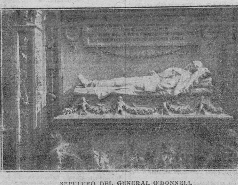
SEPULCRO DEL GENERAL O'DONNELL