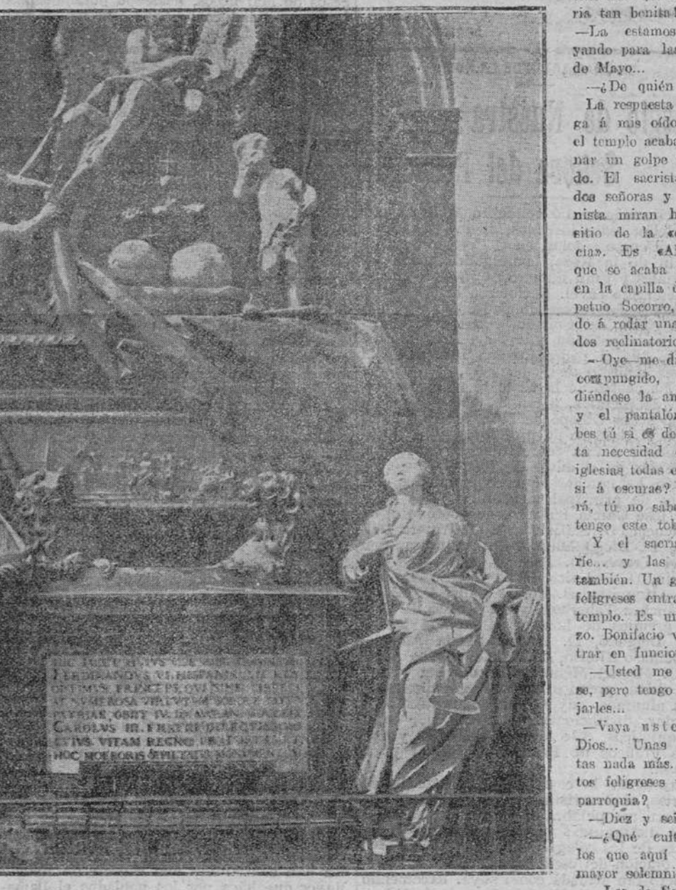
SEPULCRO DEL REY DON FERNANDO VI