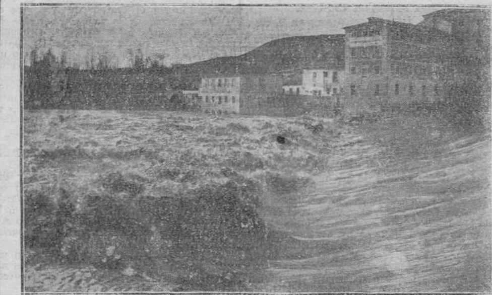
TOLEDO.—Crecida del Tajo. Una presa.

Nos gusta por lo ingenuo. El mismo Sr. Canalejas declara que el debate nacido del examen del expediente dará lugar a responsabilidades. Como si esto fuera poco, y sospechando, sin duda, que algunas de éstas han de recaer sobre él, nos advierte desde ahora que no las acepta. Con lo cual dice su señoría una enormidad ética, puesto que no pareciera sino que esto de la responsabilidad mo-