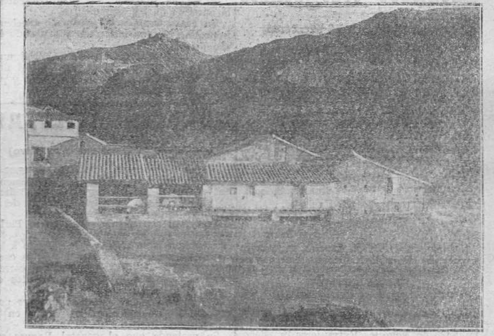
TOLEDO.—Crecida del Tajo. Molinos de San Sebastián inundados.

Añadió el Sr. Canalejas que S. M. irá de allí á Láchar, y que él se propone estar de regreso en Madrid el próximo lunes.