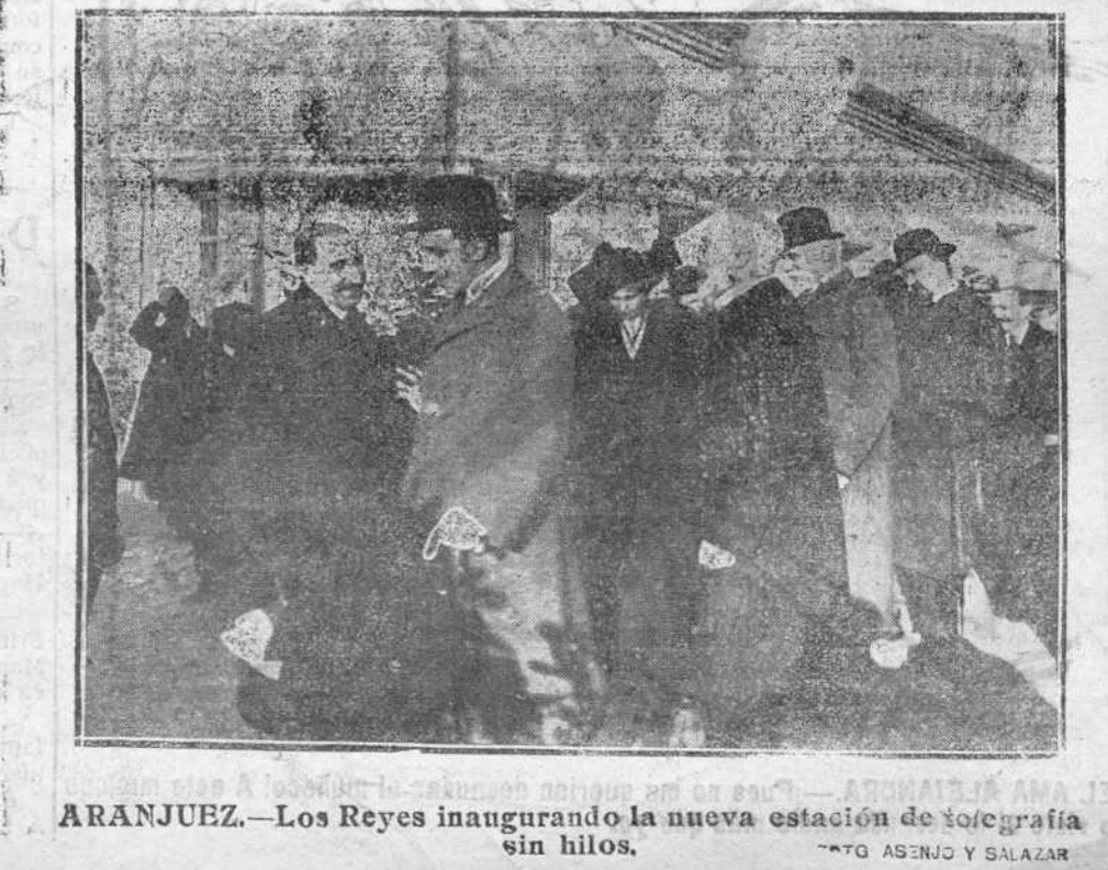
ARANJUEZ.—Los Reyes inaugurando la nueva estación de telegrafía sin hilos.