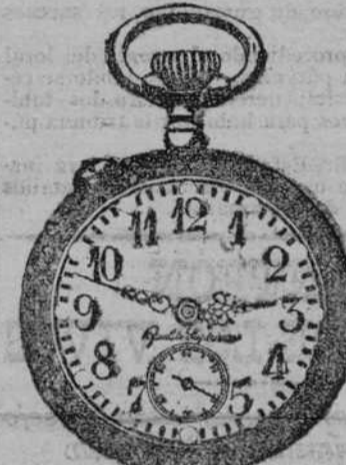
EL FANTASTICO GRAN NOVEDAD!

LA VIENESA. Reoletos, 4; Serrano, 54; San Marcos, 26, y Postas, 4. PARA PREMIOS Y LIMOSNAS. Franjas fuertes á 30 céntimos; chalecos bayona, dobles á 1,75; mantas sábanas jergones, precio muy barato, catálogos, 20.