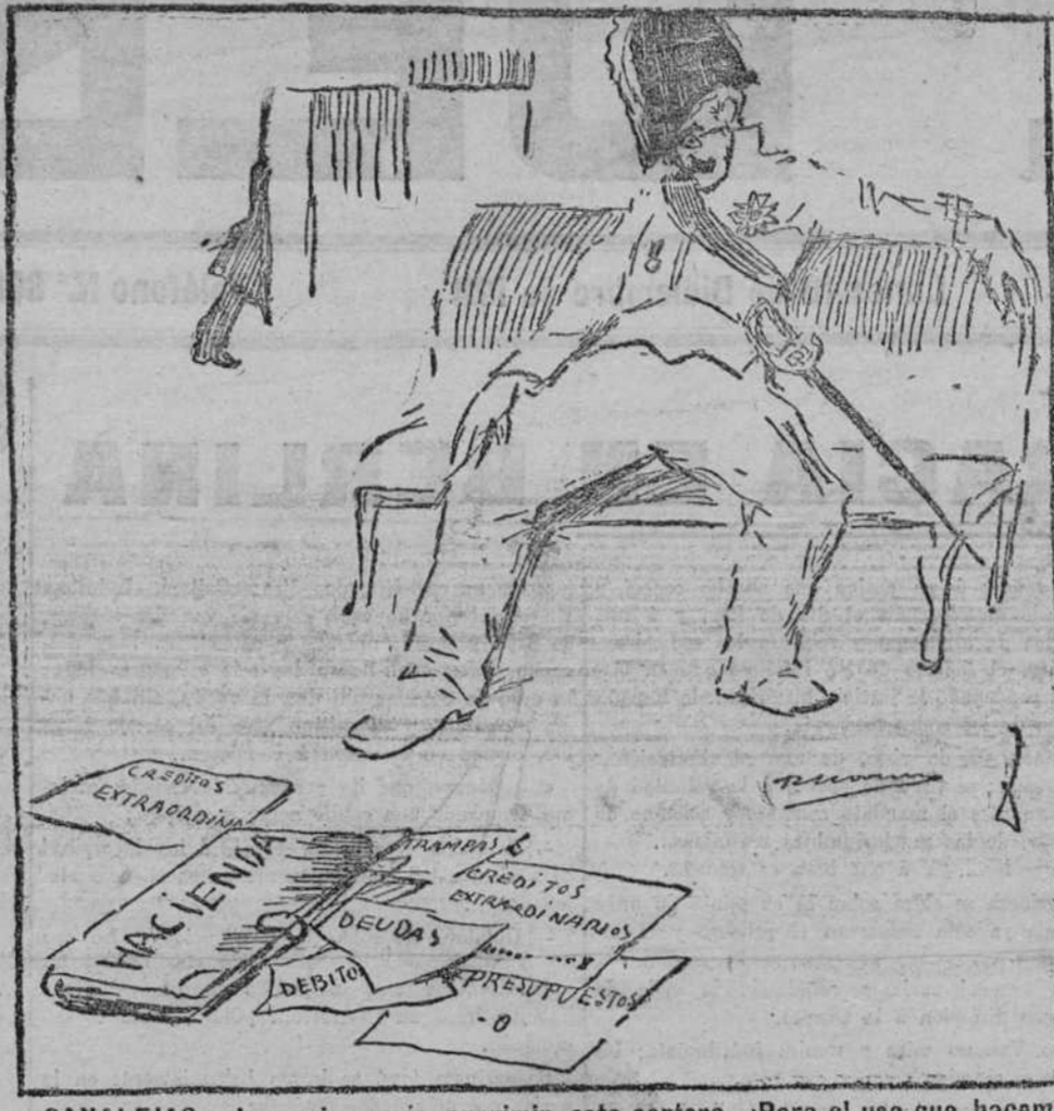
CANALEJAS.—Lo mejor sería suprimir esta cartera. ¡Para el uso que hacemos de ella.

El asunto merece que los Poderes públicos le concedan toda su atención por tratarse de la vida de muchísimos obreros, que en la actualidad se encuentran en angustiosísima y misérrima situación.