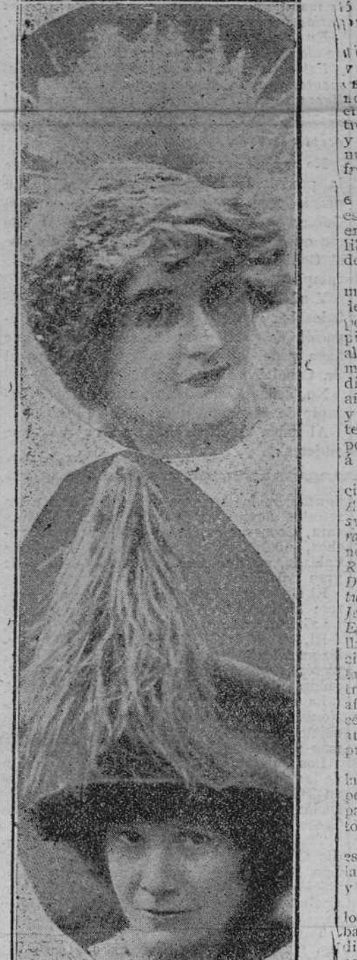
EXPLICACION DEL FIGURIN

...VOCES... RUIDO DE PESETAS... LA RONDA