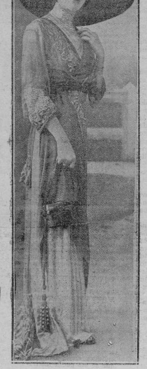
EXPLICACIÓN DEL FIGURÍN

Después de haber tratado de lo que califico ingenuamente estado mayor de la enseñanza: esa colección de inspectores generales, provinciales y regionales, que no tienen escuelas que inspeccionar, porque apenas las hay.