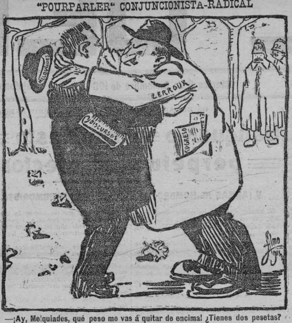
—¡Ay, Melquiades, qué peso me vas a quitar de encima! ¿Tienes dos pesetas?

En la penitenciaría de jóvenes delincuentes de Los ocurrieron ayer graves acontecimientos. Por la mañana, un grupo de jóvenes se insolentó con uno de los vigilantes, y al tratar éste de imponer su autoridad, se produjo el hecho, le maltrataron, y robándole las llaves, sacaron de sus calabozos a cuatro castigados.