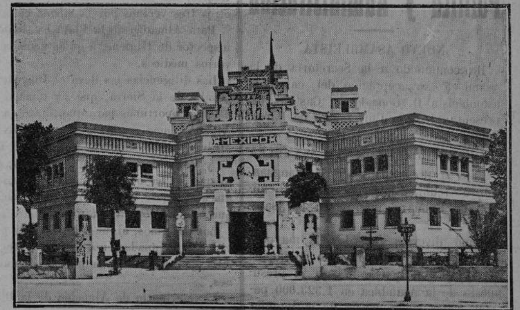
PABELLON DE MEJICO.—Arquitecto: M. Amabilis

tantes que acuden ahora son los mejores propagandistas contra los descreídos o ignorantes, ya que la propaganda oficial ha estado descuidada, con grave perjuicio para estos Certámenes.