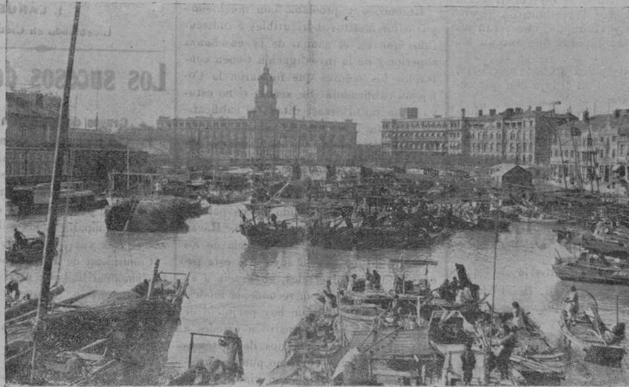
Una vista de Shanghai, la importante ciudad en torno de la cual Inglaterra y Rusia luchan denodadamente por asegurar su hegemonía en la celeste República.

en Fernando Póo los funcionarios de Correos recientemente nombrados, se procederá a la ampliación de servicios prevista en el nuevo presupuesto colonial, y particularmente a la implantación del giro postal, para cuya inauguración inmediata el gobernador general de los territorios españoles del Golfo de Guinea recibirá instrucciones precisas en el próximo correo.