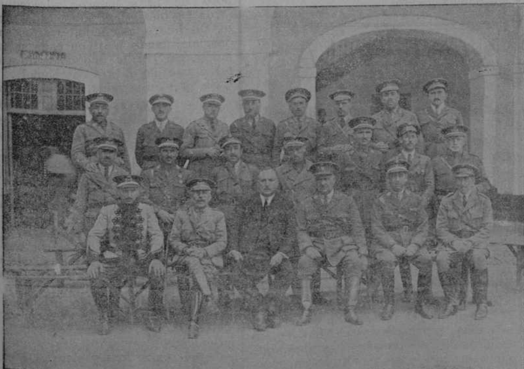
Grupo de jefes y oficiales del regimiento Cazadores de Alfonso XIII.

El vapor «C. López y López», de esta Compañía, realizará, salvo contingencias, la próxima expedición a Filipinas y Extremo Oriente, saliendo de Coruña el día 5 de mayo próximo para Vigo, Lisboa (facultativa) y Cádiz, de donde saldrá el 9 para Cartagena, Valencia, Tarragona (facultativa) y Barcelona, y de este puerto el 15 para Port Said, Suez, Colombo, Singapore, Manila, Hog-Kong, Yokohama, Kobe, Nagasaki (facultativa) y Shanghai.