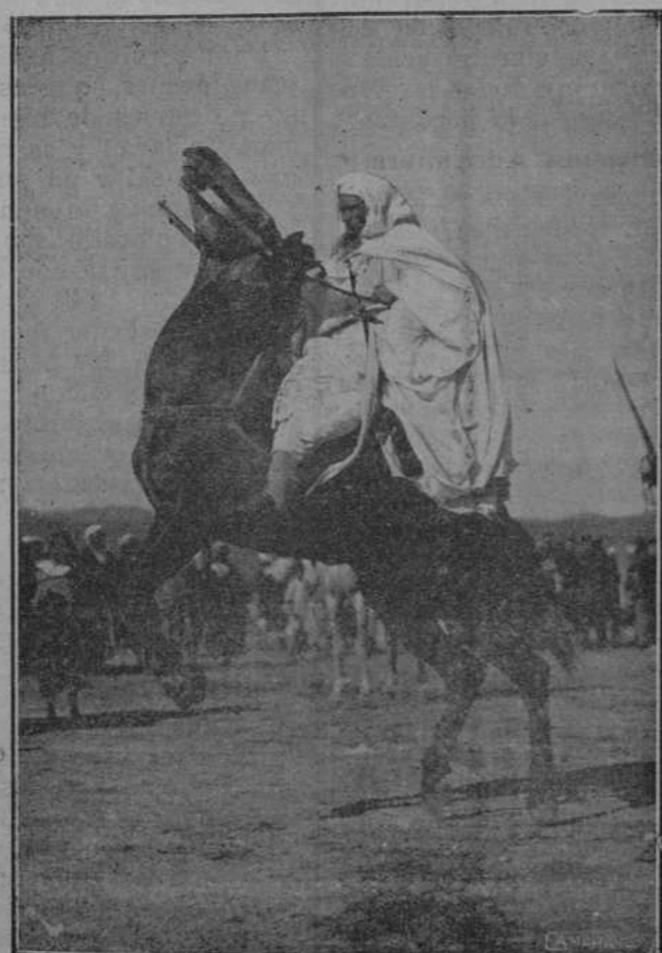
Un viejo jinete de la kabila de Metalza haciendo filigranas hípcas durante la fiesta en el morabito de Sidi-el-Hasani.