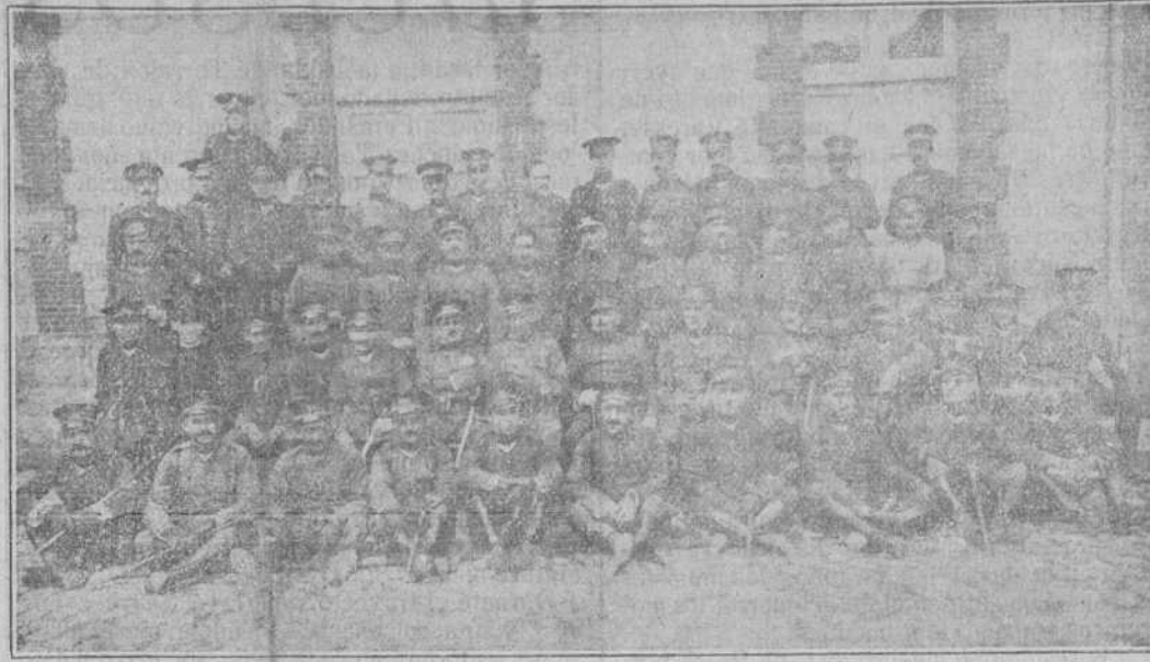
General de la brigada y jefes y oficiales del Regimiento de la Constitución

Destinos.—Mañana se publicará propuesta de destinos de médicos auxiliares.