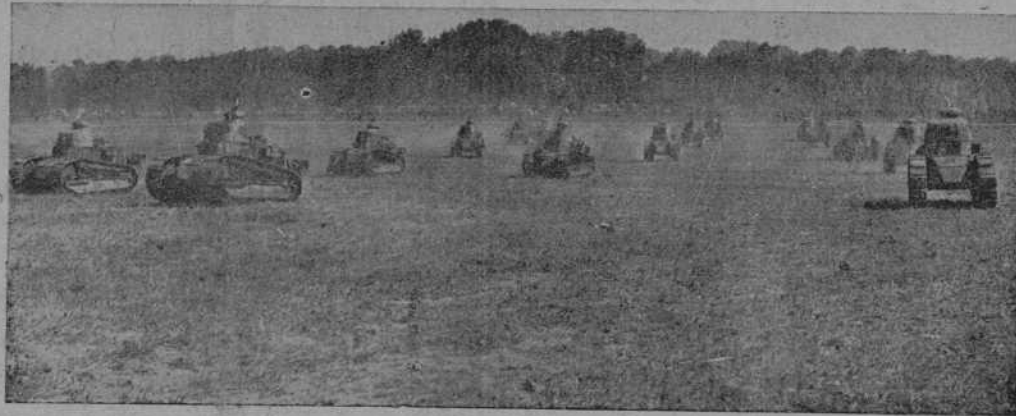
Desfile de carros de asalto franceses