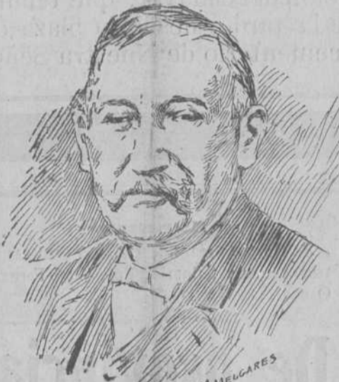
Don Benito Pérez Galdós