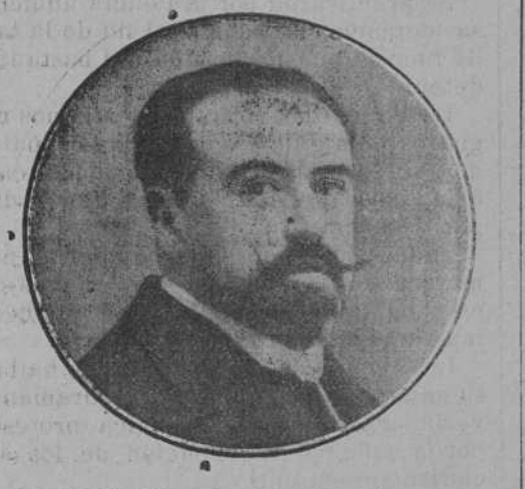
EXCMO. SR. D. SANTIAGO ALBA

El Director general de Comunicaciones manifestó que tenía reunidos los datos y cifras necesarios para contestar a las demandas de los carteros que, según rumores, están disgustados, y no contenta antes porque sería dejarse amenazar. También dijo que tenía un decreto para suprimir la obligación de los carteros de subir a los pisos.