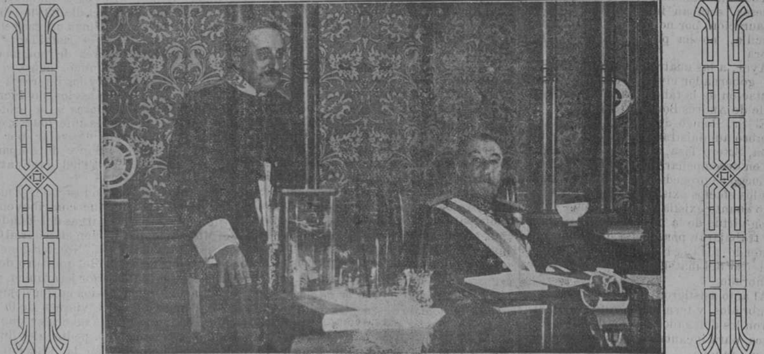
El general Muñoz-Cobo, ministro de la Guerra, y el subsecretario, general Picazo