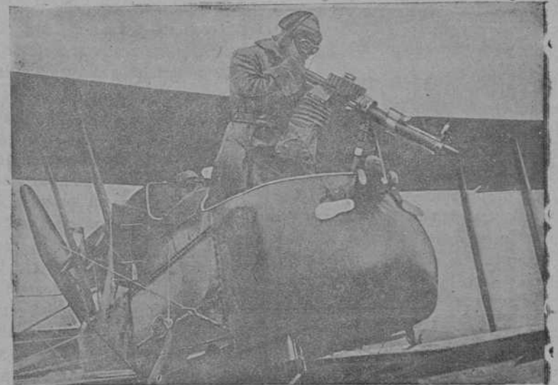
Aviador inglés en actitud de disparar sobre el enemigo.

Al norte de este punto el enemigo fué echado de Joncourt y las tropas australianas completaron la toma de las posiciones defensivas enemigas al sur de Le Catelet y Gouy.