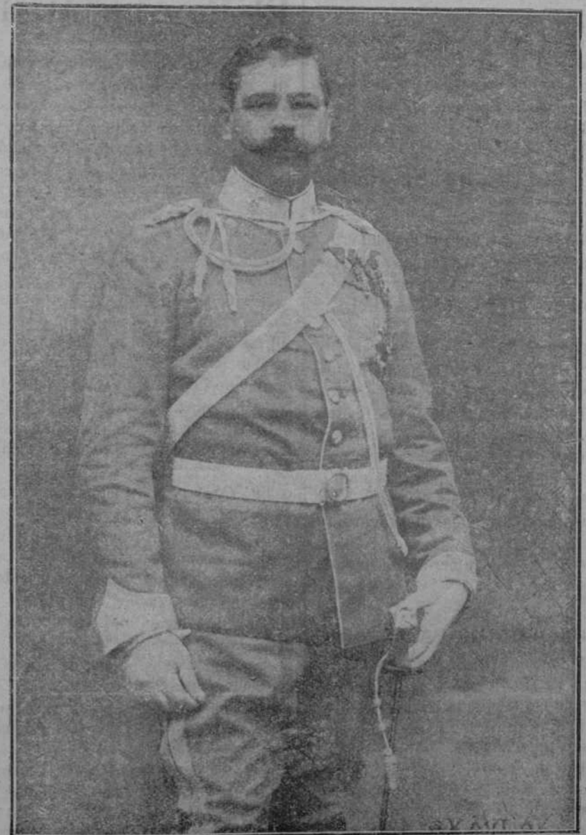
Excmo. Sr. D. Manuel Fernandez Silvestre que acaba de ser ascendido á general de division.

«Al norte de Lens y al este de Villers-Bretonneux rechazamos ataques locales del enemigo. Hubo poca actividad entre ambos bandos durante el día, pero aumentó al atardecer, logrando adquirir durante la noche átomos, al suroeste de Ypres y al repetir el enemigo sus ataques al este de Villers-Bretonneux, gran intensidad. A raíz de una gran