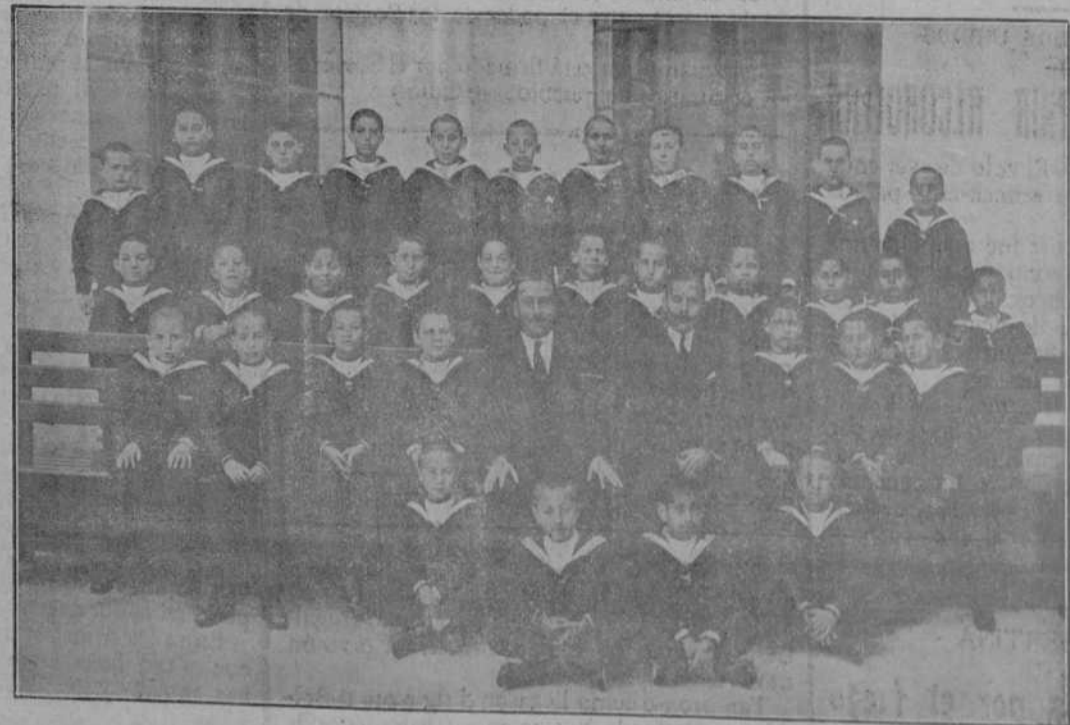
Grupo de profesores y alumnos de enseñanza el mental del Colegio de huérfanos de la Armada, en el que reciben esmeradísima educación más de un centenar de alumnos. El Cuerpo de profesores del Colegio, por la competencia y celo que desiega en el desempeño de su delicado cometido, merece los más calurosos elogios.