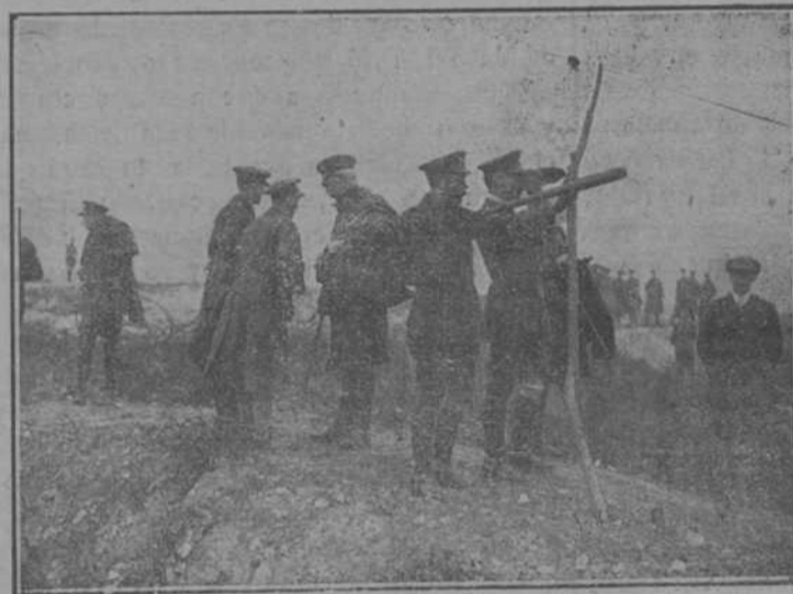
EL REY JORGE PRESENCIANDO UNA BATALLA DESDE TRINCHERAS ALEMANAS CONQUISTADAS POR LAS TROPAS INGLÉSA

Dentro de su mercado, protegido con 100 millones de habitantes, los productores de hierro y acero de los Estados Unidos podrán vender entre 20 y 30 millones de toneladas al año; pero su comercio de exportación sólo llegó a ser de un millón a dos millones de toneladas al año, mientras que las exportaciones co-