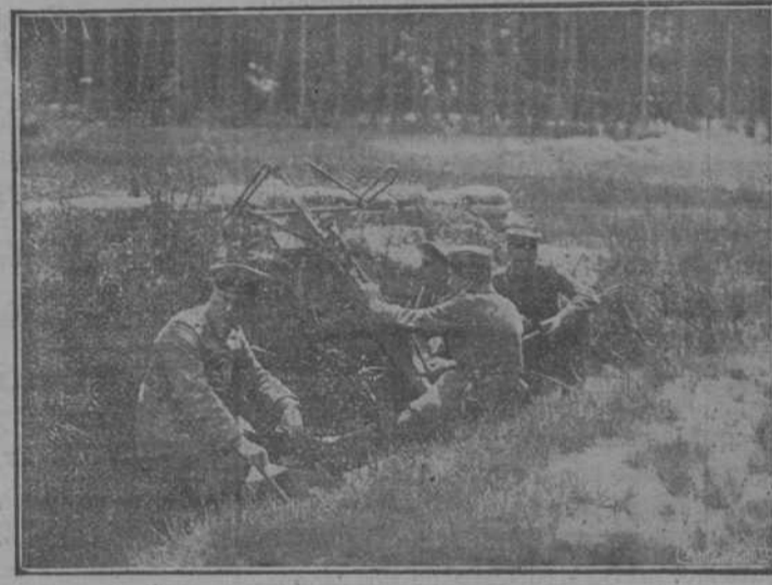
UN LANZABOMBAS FRANCÉS COGIDO POR LOS ALEMANES EN EL FRENTE OCCIDENTAL

El comandante de Marina expuso los motivos de la reunión, encareciendo la necesidad de hacer algo práctico en el sentido de recabar de los Poderes públicos los medios de hacer efectivas las aspiraciones de la ciudad, en lo tocante al problema vital del puerto de refugio.