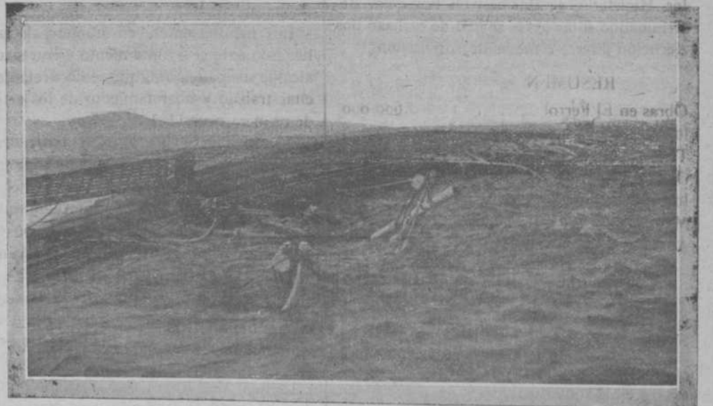
POSICIÓN EN QUE QUEDÓ EL «ALFONSO XIII» HUNDIDO EN LA BAHÍA DE SANTANDER EL DÍA 5 DEL ACTUAL

Dragado de la dársena a nueve metros y de la fosa a seis, y revestimiento de los taludes de ésta. . . . . 800.000 Dique flotante para buques de pequeño tonaje. . . . . 1.000.000 Depósitos de petróleo con sus accesorios. . . . . 500.000 Atracaderos en el Arsenal y en La Graña, vías, vagonetas, grúa transportable, medios de amarre, tubería de agua, línea telefónica y demás accesorios para muelles y aprovisionamiento de buques. . . . . 750.000