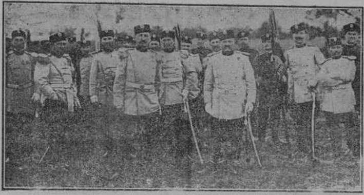
GRUPO DE JEFES Y OFICIALES SERVICIOS

Los vencedores se apoderaron de 75 cañones y 5.000 fusiles.