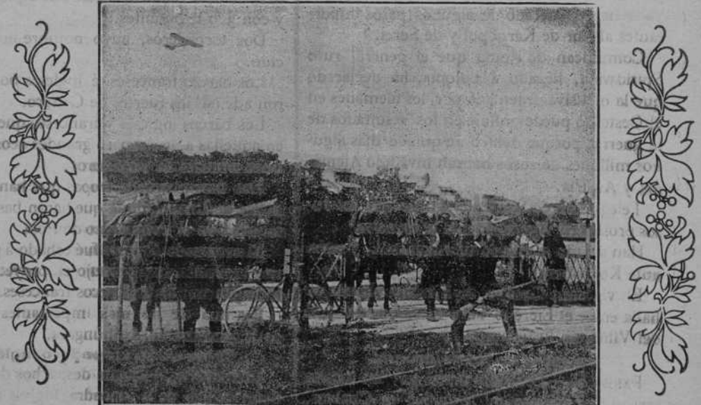
DRAGONES FRANCESES VIGILANDO UN PASO Á NIVEL

«El Ejército inglés, que se encontraba á nuestra izquierda, al Oeste del Mosa, fué atacado por los alemanes, resistiéndose con admirable impasibilidad. El Ejército francés, que operaba en la misma región, acudió en su ayuda, figurando entre las tropas los refuerzos llegados últimamente de África, que iban á la vanguardia de las fuerzas.