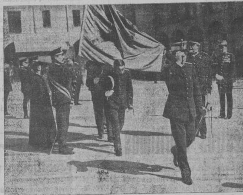
LOS NUEVOS FARMACÉUTICOS MILITARES EN LA JURA DE LA BANDERA