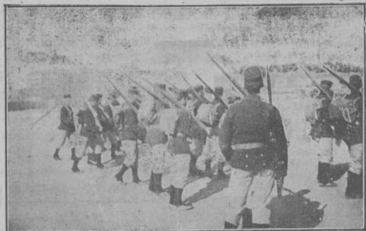
La instrucción de los reclutas.—El pelotón de los torpes.

E impuesta al nuevo académico la insignia, se dió por terminada la cuota solemneidad.