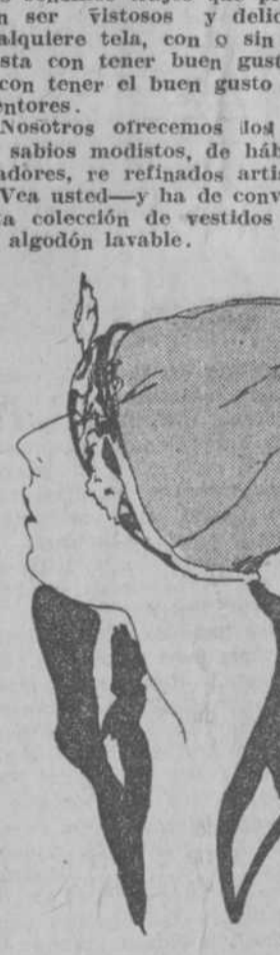
A $6.75.—Estilo muy chic. En tafetán francés, guarnecido con finos motivos bordados en el ala y gran pasador de piedras.