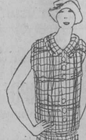
A $2.95.—Vestidos de ratiné a cuadros, en blanco, negro y colores, con detalles de muselina en el cuello y las mangas.