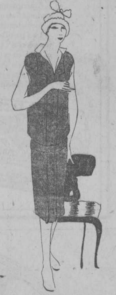
A $4.50.—Vestido forma "sport" en tejido esterilla; cuello y bolsillos guarnecidos con muselina; botones de pasta al frente.

venta estos vestidos, además de en nuestro departamento de confecciones, en percheros provisionales colocados; uno junto a la puerta de entrada al establecimiento por San Rafael, otro a la entrada por Aguilá. Acompañan a estas líneas unos modelos, que vale lo que una elocuente demostración gráfica.