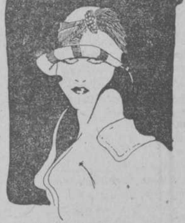
A $4.50.—Sombrero de tafetán de seda adornado con bonitos plegados en el ala y un gran lazo de cinta sobre la copa.

Lo que ofrecemos a esos precios es cuestión de tener más o menos. Como sabemos por experiencia que éstos extraordinarios ofrecimientos nuestros son siempre acogidos con entusiasmo por nuestra sensata clientela, hemos puesto a la