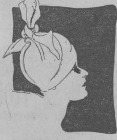
A $8.50.—Moderno estilo en "satin-fulgurante" combinado en dos tonos, guarnecido con finos bieses y bellísimo lacito en forma de qresta.

del más estricto sentido de la moda, de aplicación en estos primeros días primaverales. Esos trajes de uso corriente, propios para las salidas matinales, para paseos en automóvil, para diligencias por la tarde, para recibir visitas. Los trajes a que apela en la mayor parte de las horas del día toda mujer que tiene de la vida un concepto serio, práctico y distinguido.