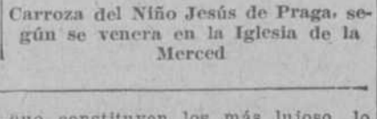
Carroza del Niño Jesús de Praga según se venera en la Iglesia de la Merced