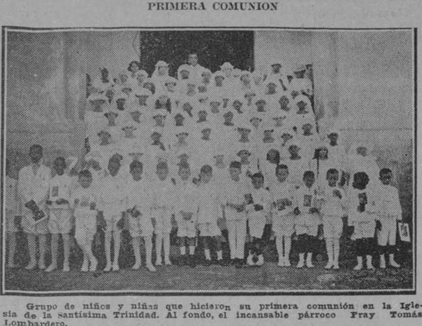
Grupo de niños y niñas que hicieron su primera comunión en la Iglesia de la Santísima Trinidad...